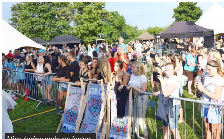
Mieszkańcy podczas festynu