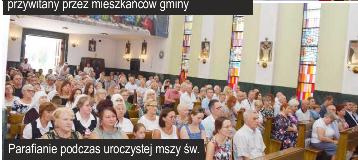
Parafianie podczas uroczystej mszy św.