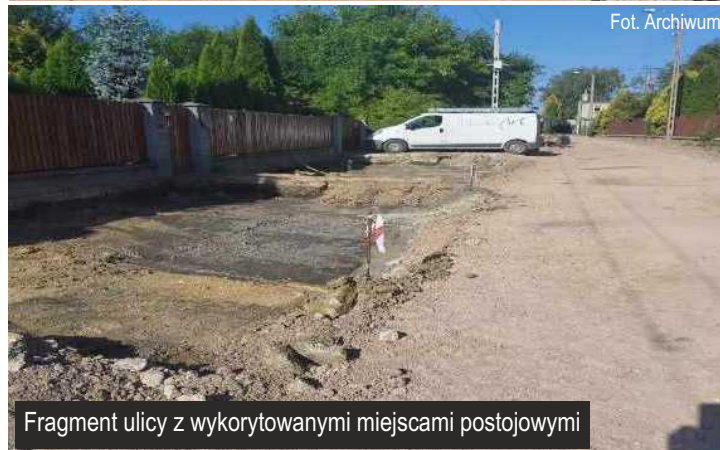
Fragment ulicy z wykorytowanymi miejscami postojowymi