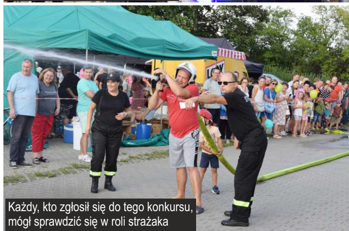
Każdy, kto zgłosił się do tego konkursu, mógł sprawdzić się w roli strażaka