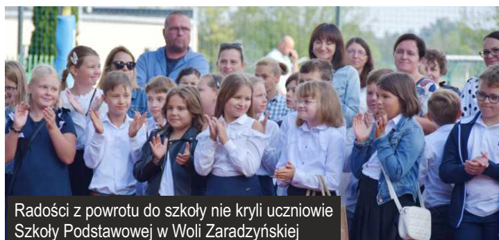
Radości z powrotu do szkoły nie kryli uczniowie Szkoły Podstawowej w Woli Zaradzyńskiej