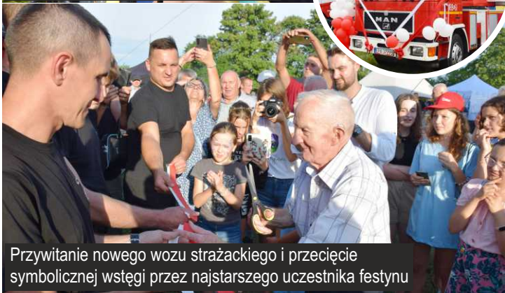
Przywitanie nowego wozu strażackiego i przecięcie symbolicznej wstęgi przez najstarszego uczestnika festynu