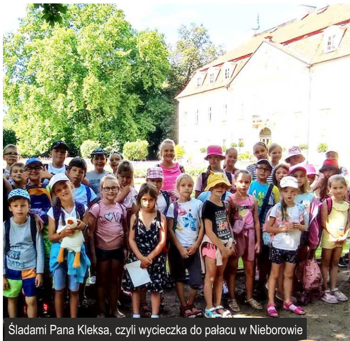
Śladami Pana Kleksa, czyli wycieczka do pałacu w Nieborowie