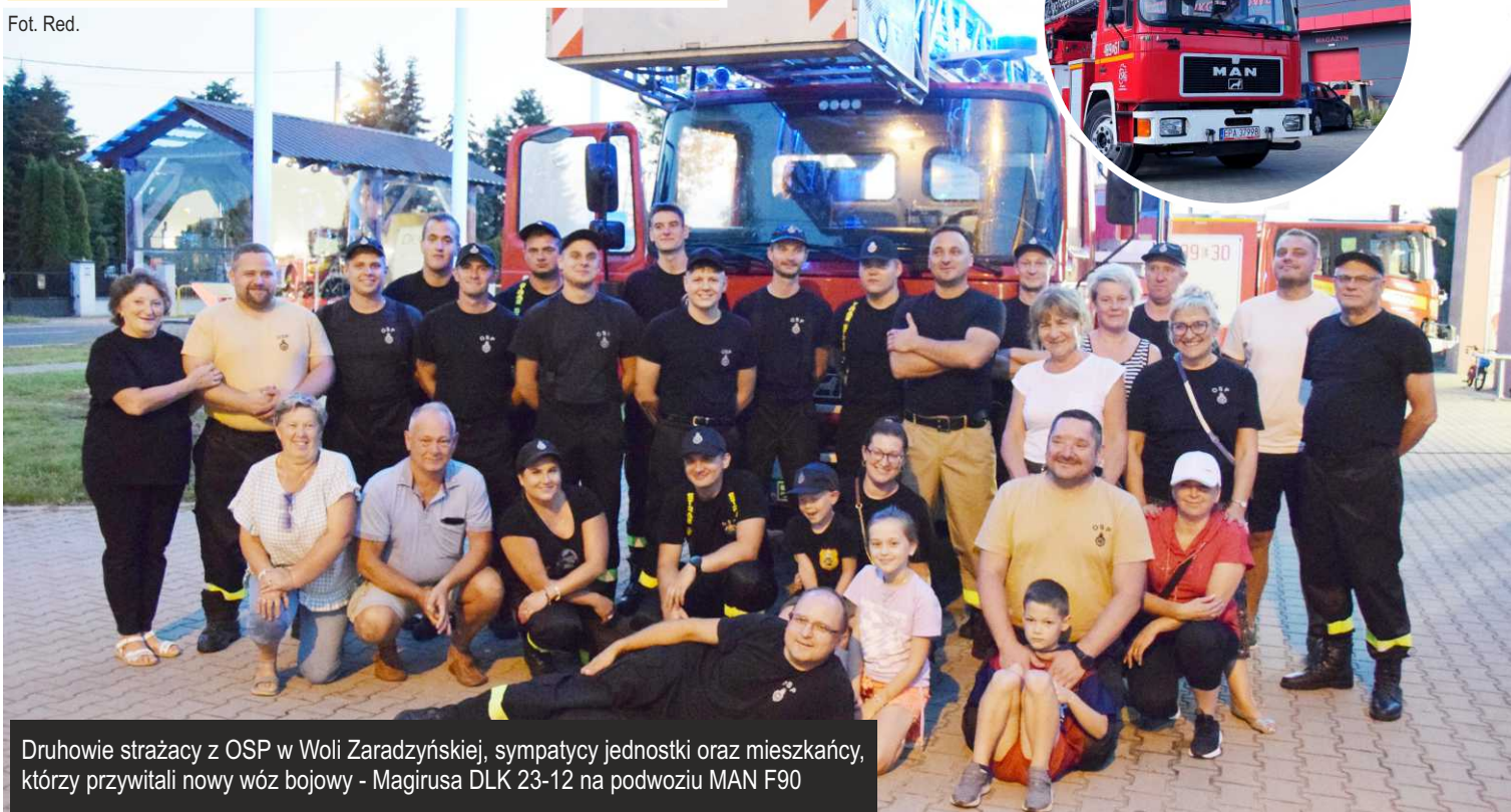
Druhowie strażacy z OSP w Woli Zaradzyńskiej, sympatycy jednostki oraz mieszkańcy, którzy przywitani nowy wóz bojowy - Magirusa DLK 23-12 na podwoziu MAN F90

23 sierpnia do jednostki Ochotniczej Straży Pożarnej w Woli Zaradzyńskiej trafił długo wyczekiwany bojowy wóz drabiniasty - Magirus DLK 23-12 na podwoziu MAN F90. To trzecie auto w garażu naszych strażaków. Druhowie wyjeżdżali dotąd na akcje dużą Scanią, mniejszym Peugeotem i średnim Iveco, który został sprzedany innej jednostce.