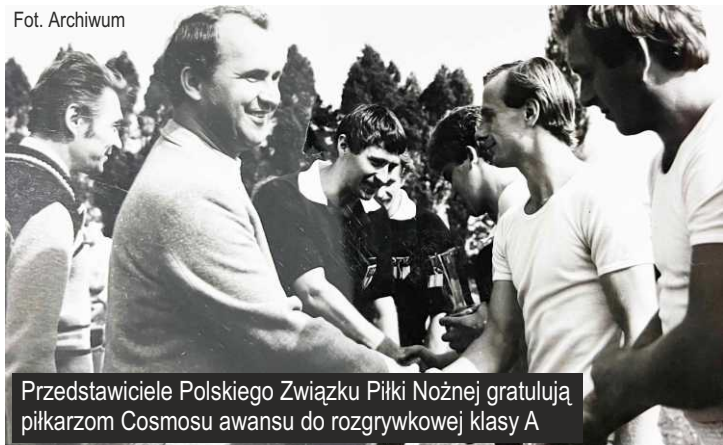
Przedstawiciele Polskiego Związku Piłki Nożnej gratulują piłkarzom Cosmosu awansu do rozgrywkowej klasy A