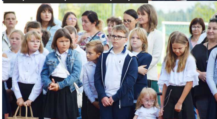
Uczniowie Szkoły Podstawowej w Ksawerowie również z uśmiechem wrócili po wakacyjnej przerwie