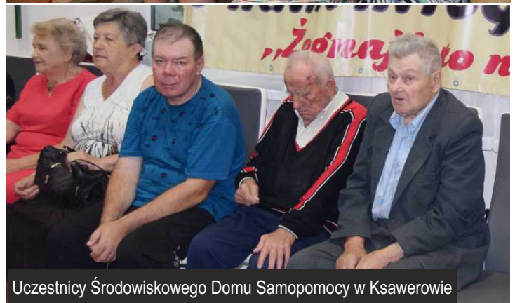
Uczestnicy Środowiskowego Domu Samopomocy w Ksawerowie