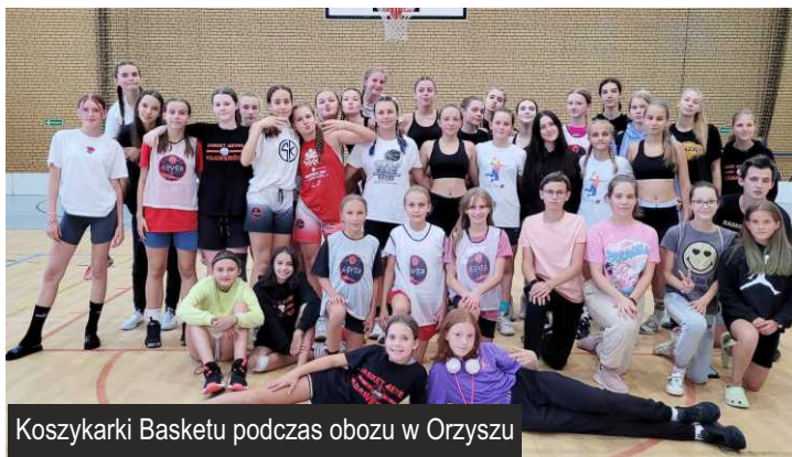
Koszykarki Basketu podczas obozu w Orzyszu

Oboz został podzielony na dwa turnusy, najpierw najmłodsze adeptki koszykówki (kategoria u12/u11 i młodsze), a później starsze koleżanki (kategoria u13, u14, u15 i u17) przygotowywały się do nowego sezonu. Ogromna ilość atrakcji, animacji, zabaw i treningów sprawiły, że zawodniczki z wielkim smutkiem opuszczały uroczne Mazury. Mamy jednak nadzieję, że jeszcze tam wrócimy.