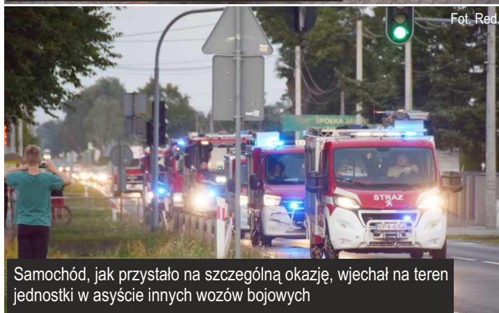
Tak prezentuje się nowy, specjalistyczny pojazd