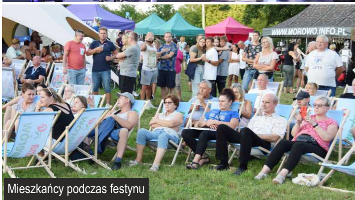
Mieszkańcy podczas festynu