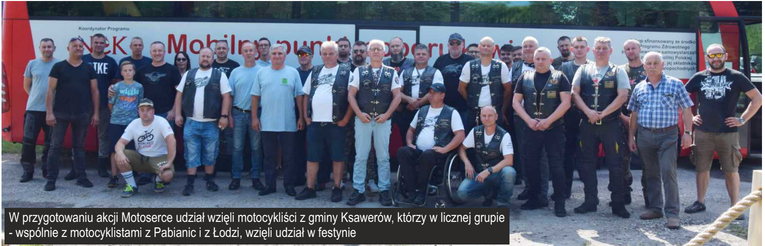
W przygotowaniu akcji Motoserce udział wzięli motocykliści z gminy Ksawerów, którzy w licznej grupie - wspólnie z motocyklistami z Pabianic i z Łodzi, wzięli udział w festynie