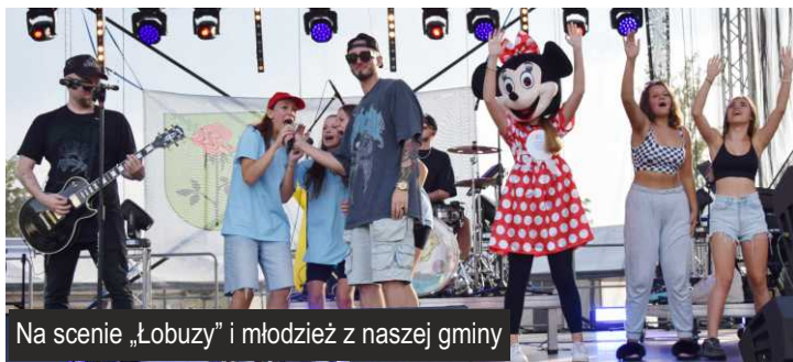
Na scenie „Łobuzy” i młodzież z naszej gminy

Referat Oświaty, Spraw Społecznych i Promocji