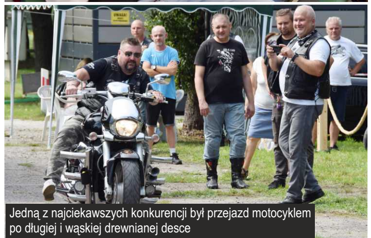
Jedną z najciekawszych konkurencji był przejazd motocyklem po długiej i wąskiej drewnianej desce