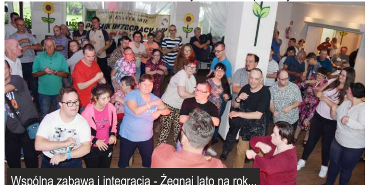
Wspólna zabawa i integracja - Żegnaj lato na rok...

Środowiskowy Dom Samopomocy w Ksawerowie