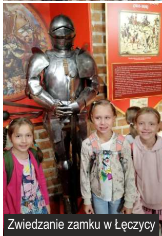
Zwiedzanie zamku w Łęczycy