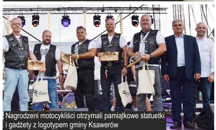
Nagrodzeni motocykliści otrzymali pamiątkowe statuetki i gadżety z logotypem gminy Ksawerów