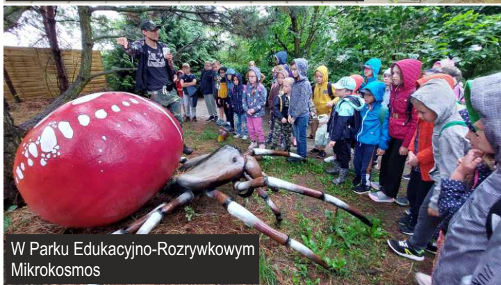
W Parku Edukacyjno-Rozrywkowym Mikrokosmos