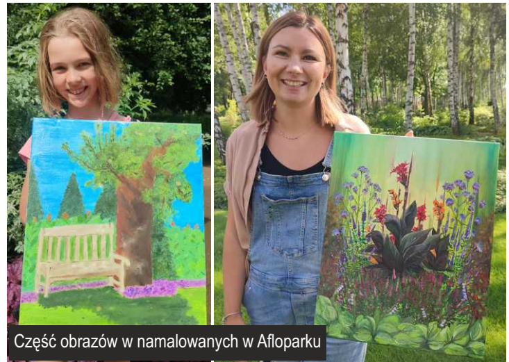
Część obrazów w namalowanych w Afloparku