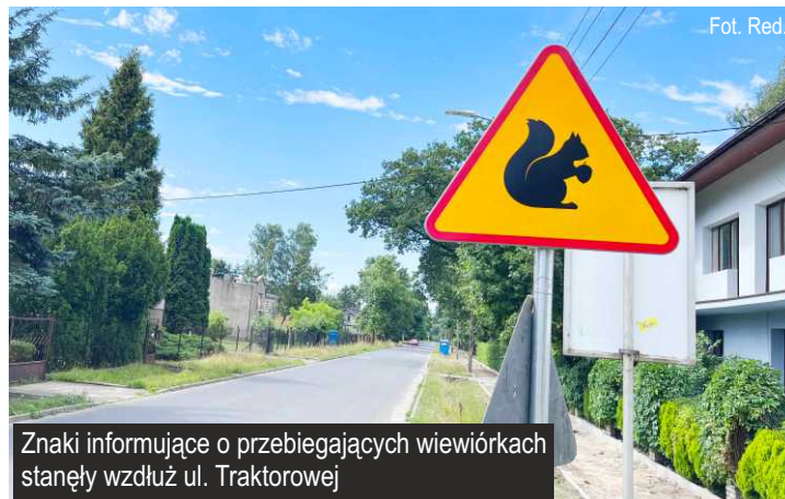
Znaki informujące o przebiegających wiewiórkach stanęły wzdłuż ul. Traktorowej

Na ulicy Traktorowej zostały postawione dwa nowe znaki ostrzegające, dotyczące małych mieszkańców Ksawerowa - wiewiórek. Znaki zostały ustawione za skrzyżowaniem z ul. Głowackiego i za skrzyżowaniem z ul. Kościuszki. Nowe znaki mają zachęcać kierowców do ostrożności na drogach.