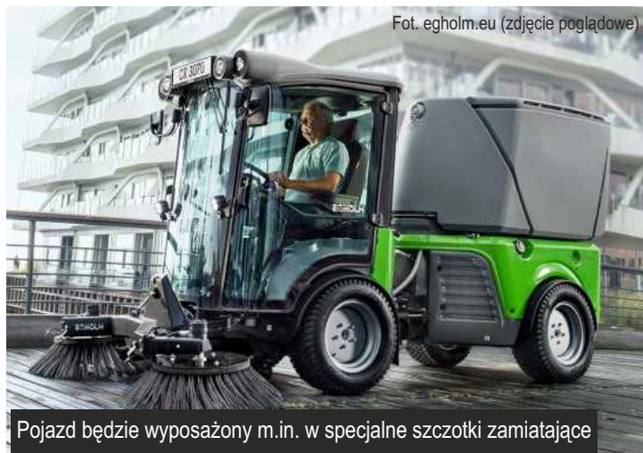
(zdjęcie poglądowe)