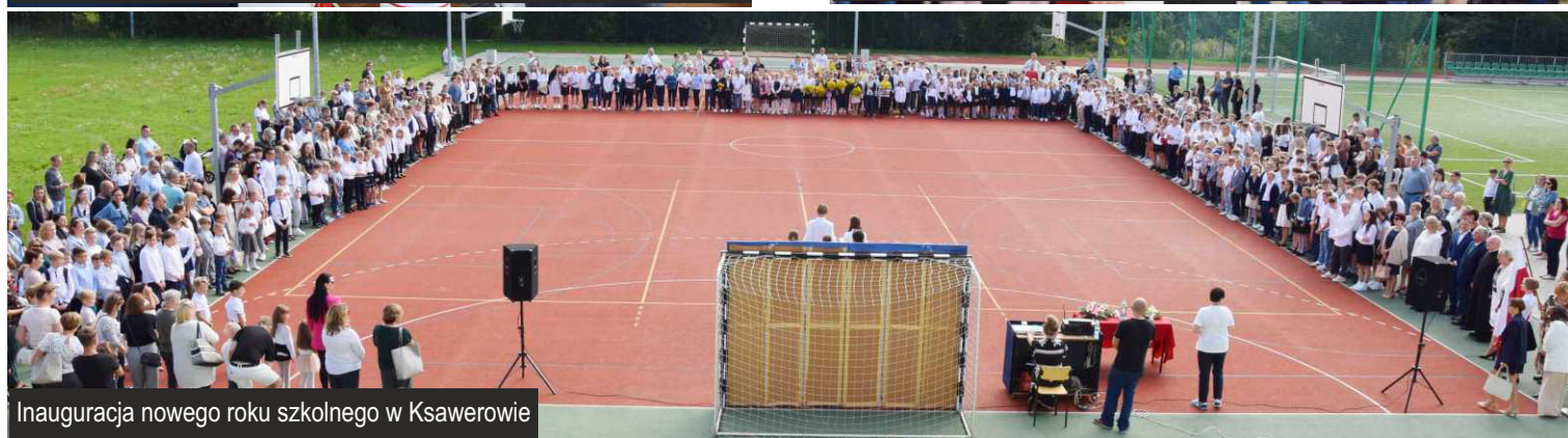
Inauguracja nowego roku szkolnego w Ksawerowie