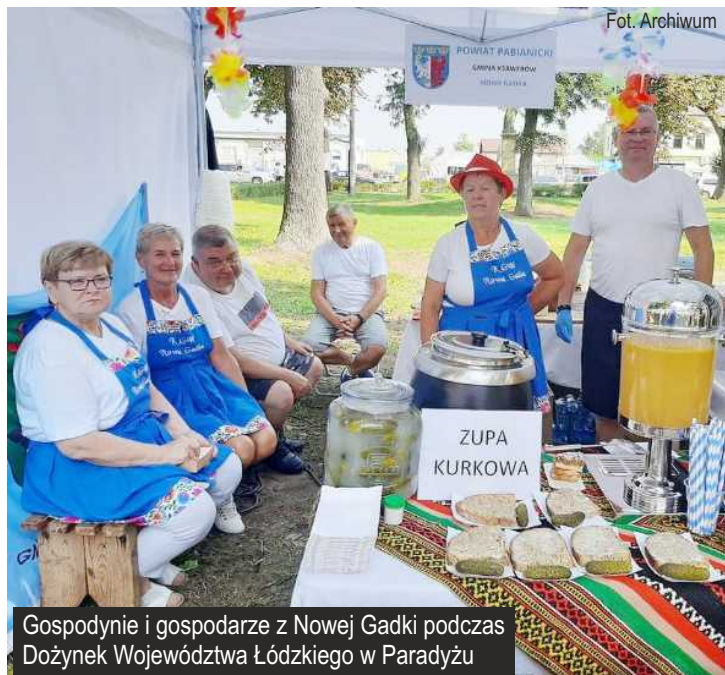
Gospodynie i gospodarze z Nowej Gadki podczas Dożynek Województwa Łódzkiego w Paradyżu

W niedzielę 20 sierpnia br. odbyły się Dożynki Województwa Łódzkiego w Paradyżu. W programie wydarzenia był m.in. Konkurs kulinarny dla Kół Gospodyń Wiejskich z województwa łódzkiego, koncerty muzyczne oraz liczne zabawy i konkursy dla uczestników. W imprezie udział wzięła reprezentacja naszej gminy - Koło Gospodyń Wiejskich z Nowej Gadki.