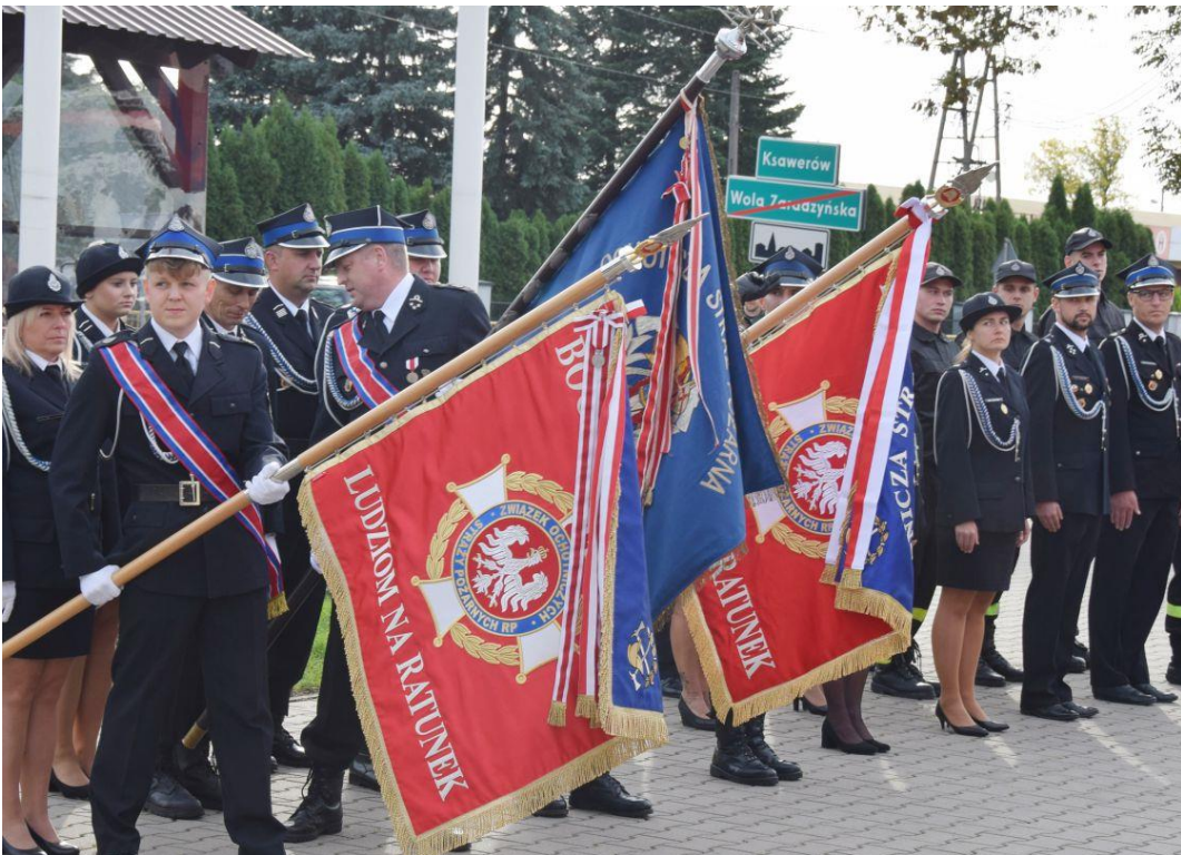
Fotografia przedstawia drużny i druhow strażaków uczestniczących w uroczystości.