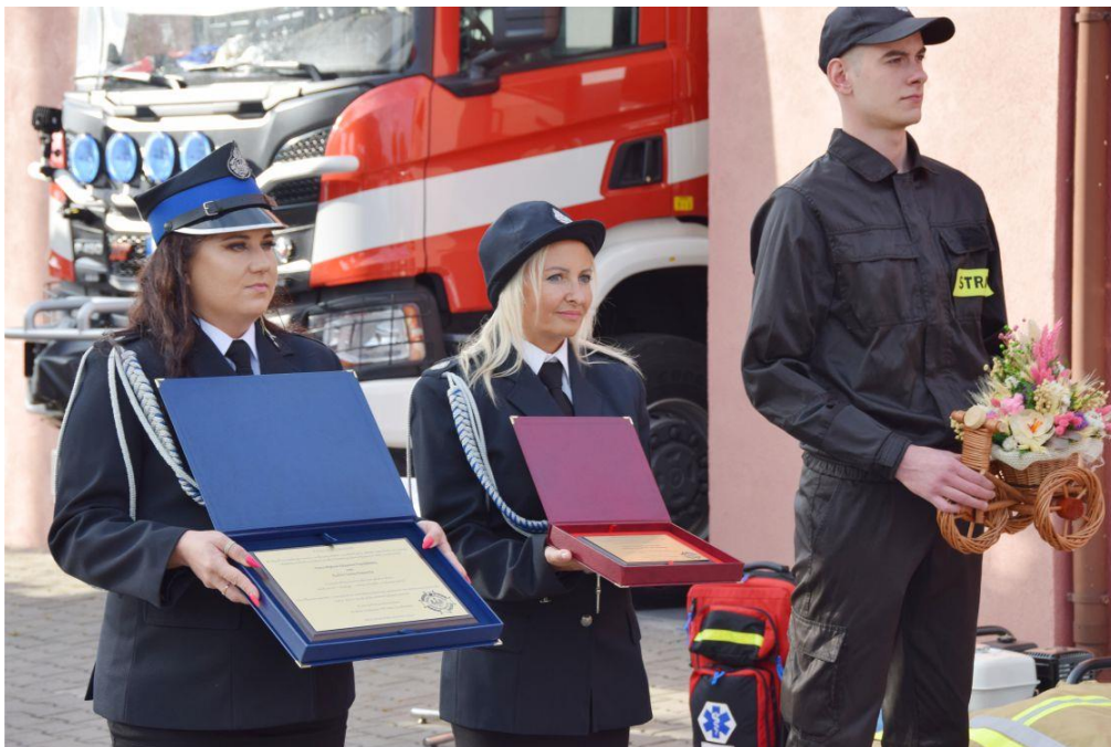
Fotografia przedstawia drużny i druha strażaka z pamiątkowymi upominkami dotyczącymi uroczystości.