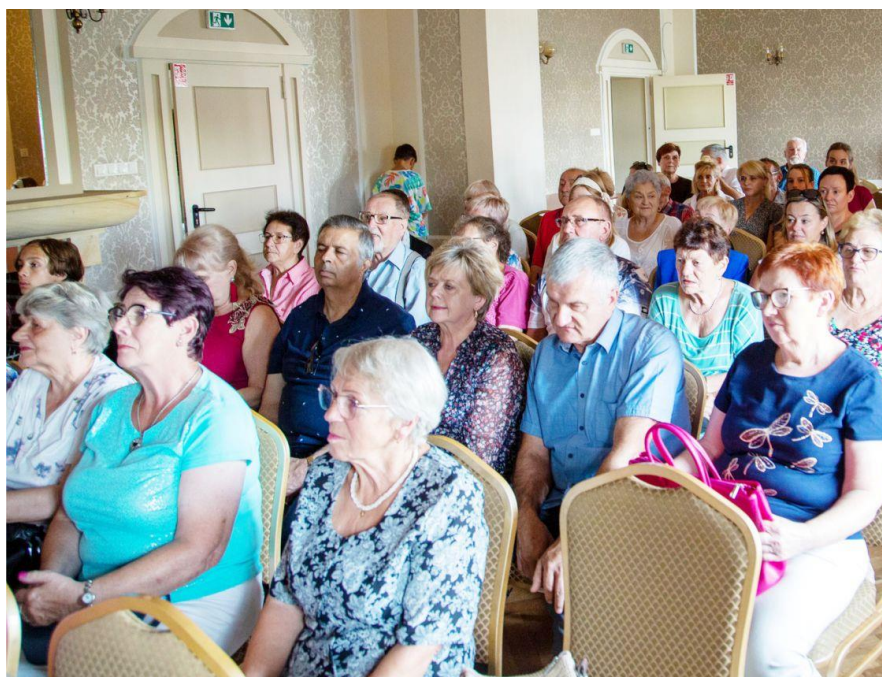
Fotografia przedstawia mieszkańców gminy Ksawerów podczas „Narodowego Czytania”. Fotografia jest archiwalna. Informację przygotował Gminny Dom Kultury z Biblioteką w Ksawerowie.