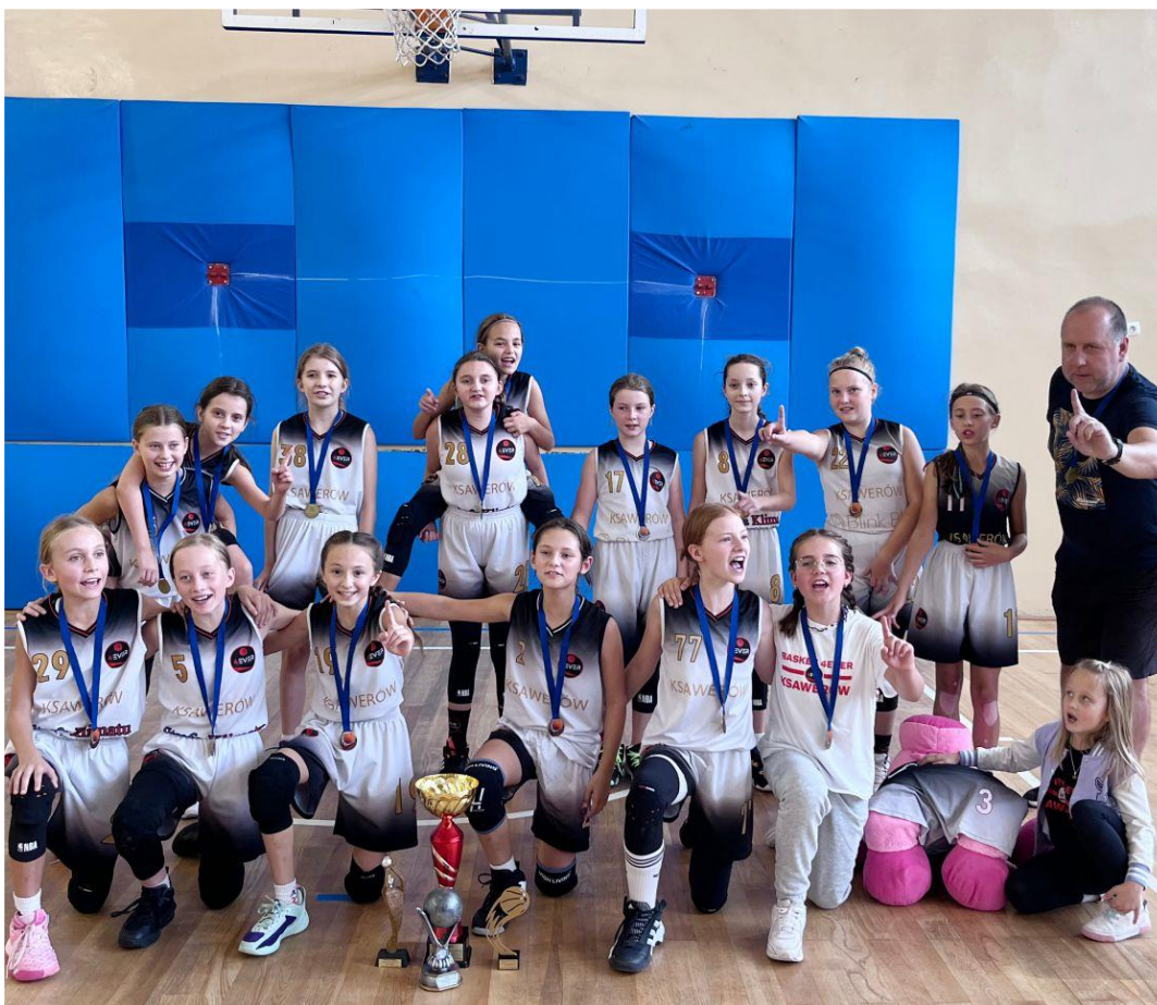
Fotografia przedstawia koszykarki Basket 4Ever Ksawerów U12, które zajęły pierwsze miejsce w turnieju. Fotografia jest archiwalna.

przeciwniczkom na turnieju w Kórniku (woj. wielkopolskie). U15 rozegrały kilka meczów kontrolnych na własnej hali, U17 wywalczyły 2 miejsce na turnieju w Bydgoszczy, a U19 i 2lk szlifowały umiejętności na turnieju w Gdyni.