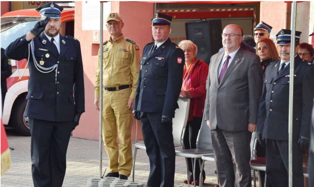
Fotografia przedstawia uczestników uroczystości.