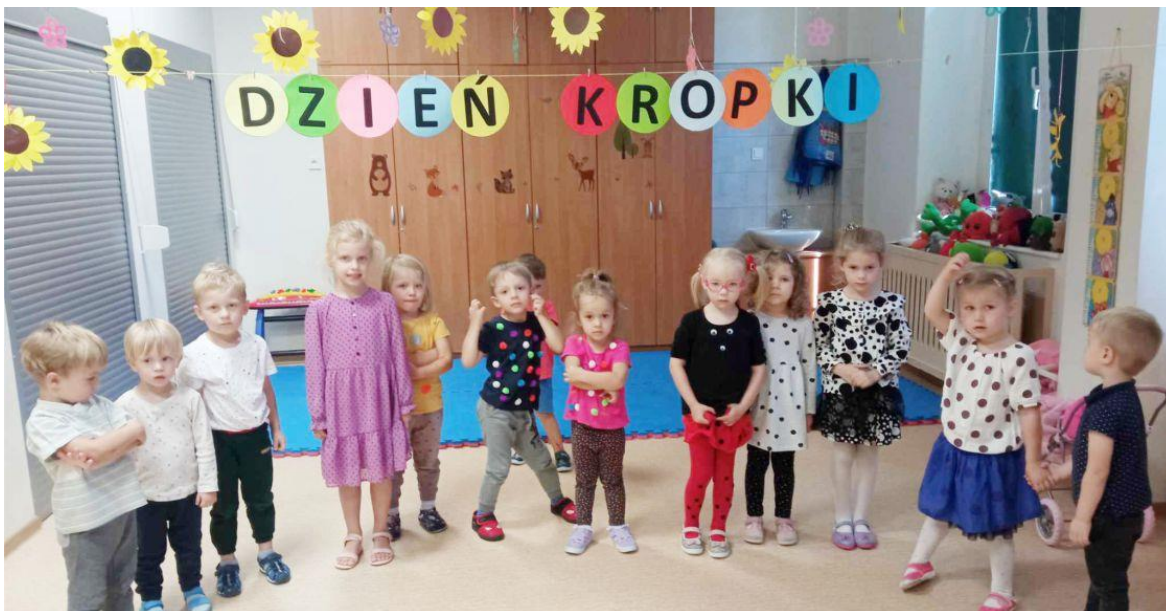
Fotografia przedstawia przedszkolaki podczas Międzynarodowego Dnia Kropki. Fotografia jest archiwalna.