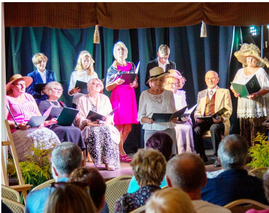
Fotografia przedstawia członków Gminnego Klubu Seniora z Ksawerowa podczas „Narodowego Czytania”. Fotografia jest archiwalna.