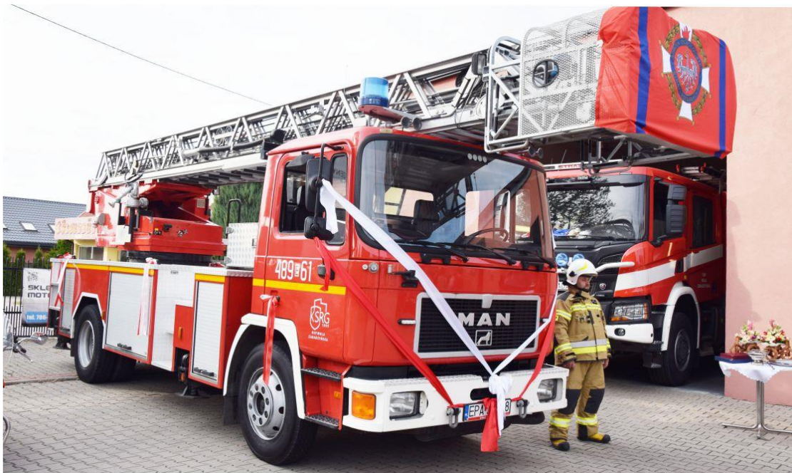
Fotografia przedstawia nowy wóz bojowy – samochód strażacki na terenie jednostki OSP w Woli Zaradzyńskiej.