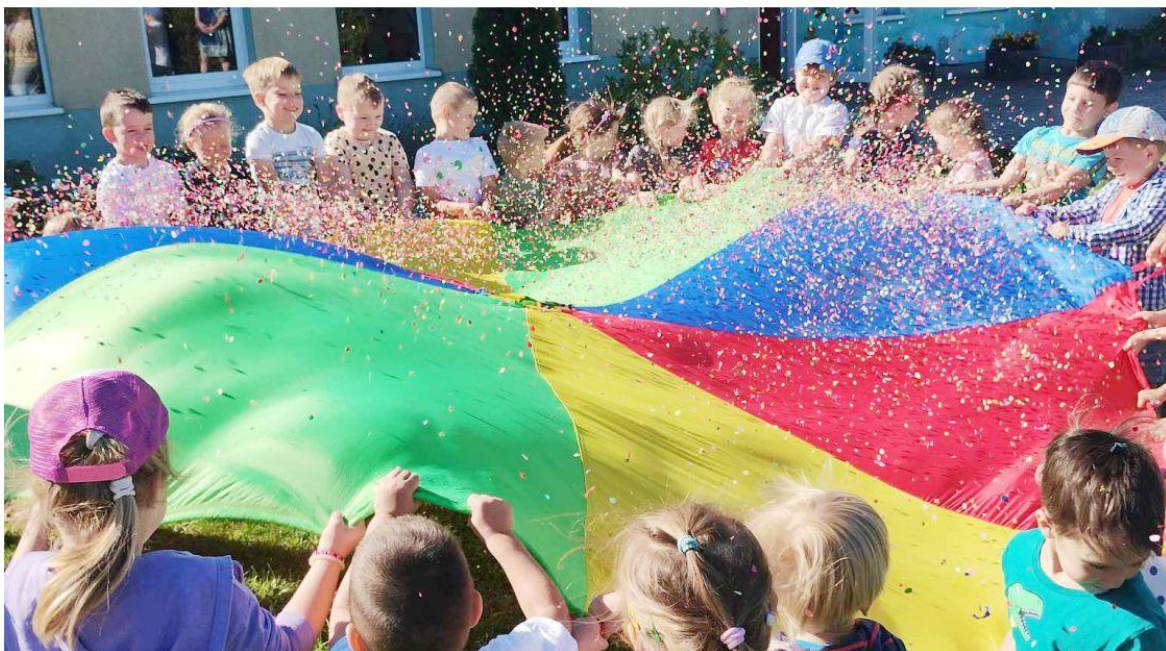
Fotografia przedstawia przedszkolaki podczas Międzynarodowego Dnia Kropki. Fotografia jest archiwalna. Informację przygotował Zespół Szkolno-Przedszkolny w Ksawerowie.