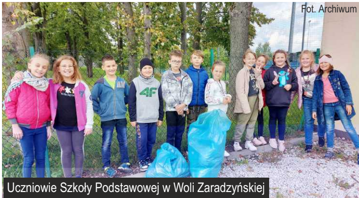
Uczniowie Szkoły Podstawowej w Woli Zaradzyńskiej