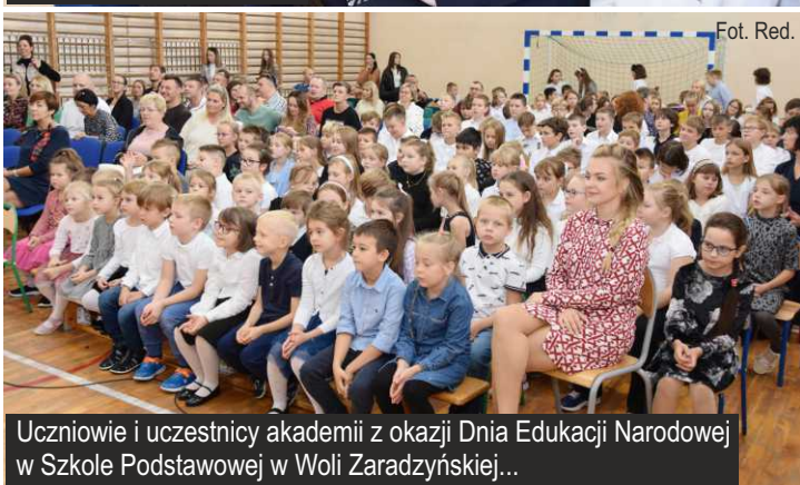
Uczniowie i uczestnicy akademii z okazji Dnia Edukacji Narodowej w Szkole Podstawowej w Woli Zaradzyńskiej...