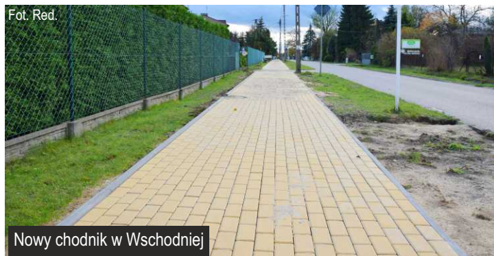
Nowy chodnik w Wschodniej

Przyznane gminie Ksawerów środki w wysokości 336 117,00 zł. pochodzą z Rządowego Funduszu Rozwoju Dróg.