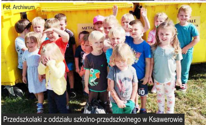
Przedszkolaki z oddziału szkolno-przedszkolnego w Ksawerowie