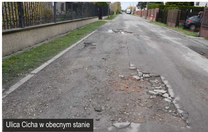
Ulica Cicha w obecnym stanie

Wykonawca tej inwestycji, w ramach podpisanej w czerwcu umowy z gminą Ksawerów, wykona również remont ul. Cichej. Prace budowlane powinny zakończyć się w tym roku.