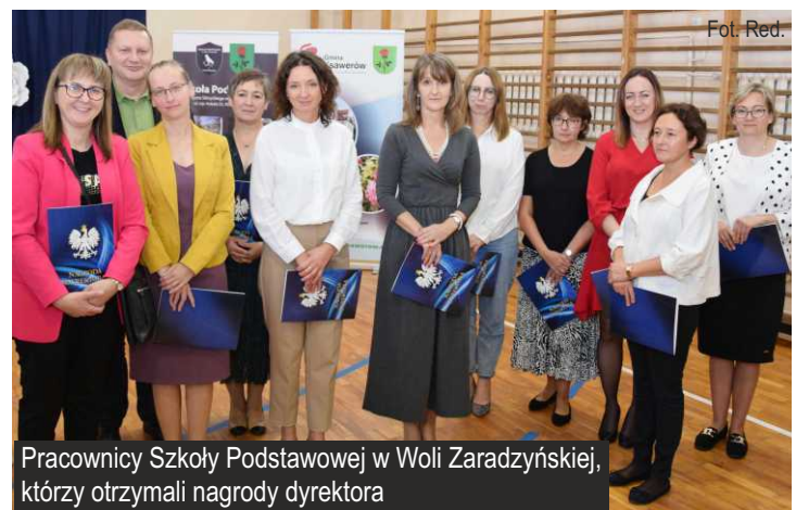
Pracownicy Szkoły Podstawowej w Woli Zaradzyńskiej, którzy otrzymali nagrody dyrektora

Referat Oświaty, Spraw Obywatelskich i Promocji