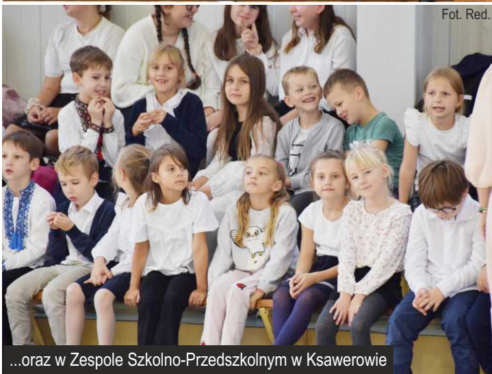
...oraz w Zespole Szkolno-Przedszkolnym w Ksawerowie