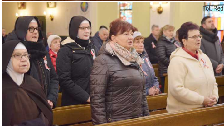
Uczestnicy mszy św. w intencji Ojczyzny w Woli Zaradzyńskiej oraz w Ksawerowie (zdjęcie poniżej)