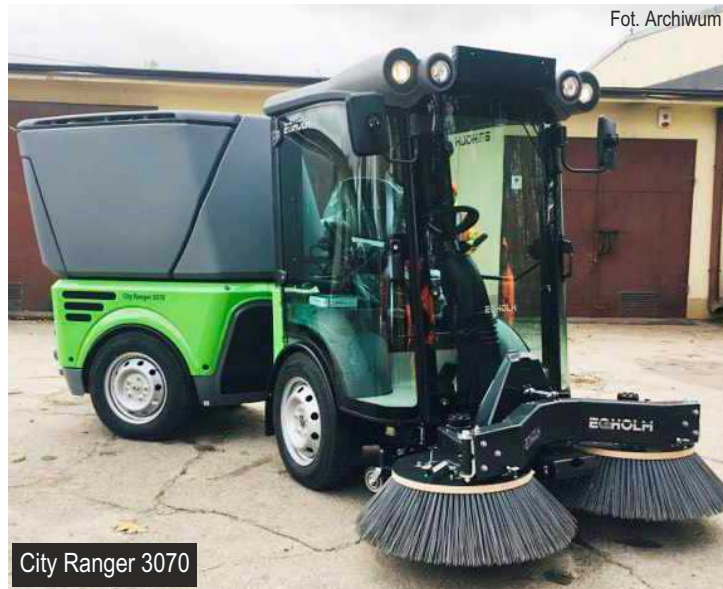
City Ranger 3070