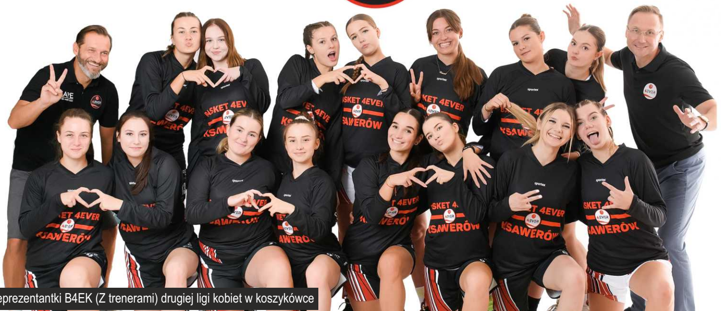
Reprezentantki B4EK (Z trenerami) drugiej ligi kobiet w koszykówce

Nasze seniorki, koszykarki Basket 4Ever Ksawerów grające w drugiej lidze kobiet rozpoczęły sezon. W inauguracyjnym spotkaniu zmierzyły się z drużyną z województwa warmińsko-mazurskiego - Dwójką Nidzica.