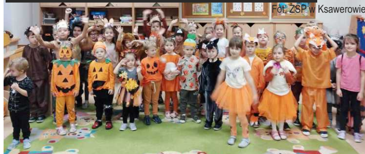
Bal Jesieni w Zespole Szkolno-Przedszkolnym w Ksawerowie