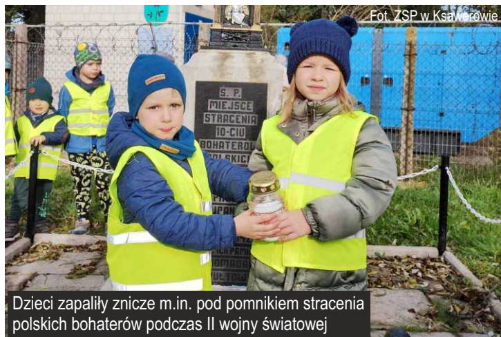
Dzieci zapaliły znicze m.in. pod pomnikiem stracenia polskich bohaterów podczas II wojny światowej

Zespół Szkolno-Przedszkolny w Ksawerowie