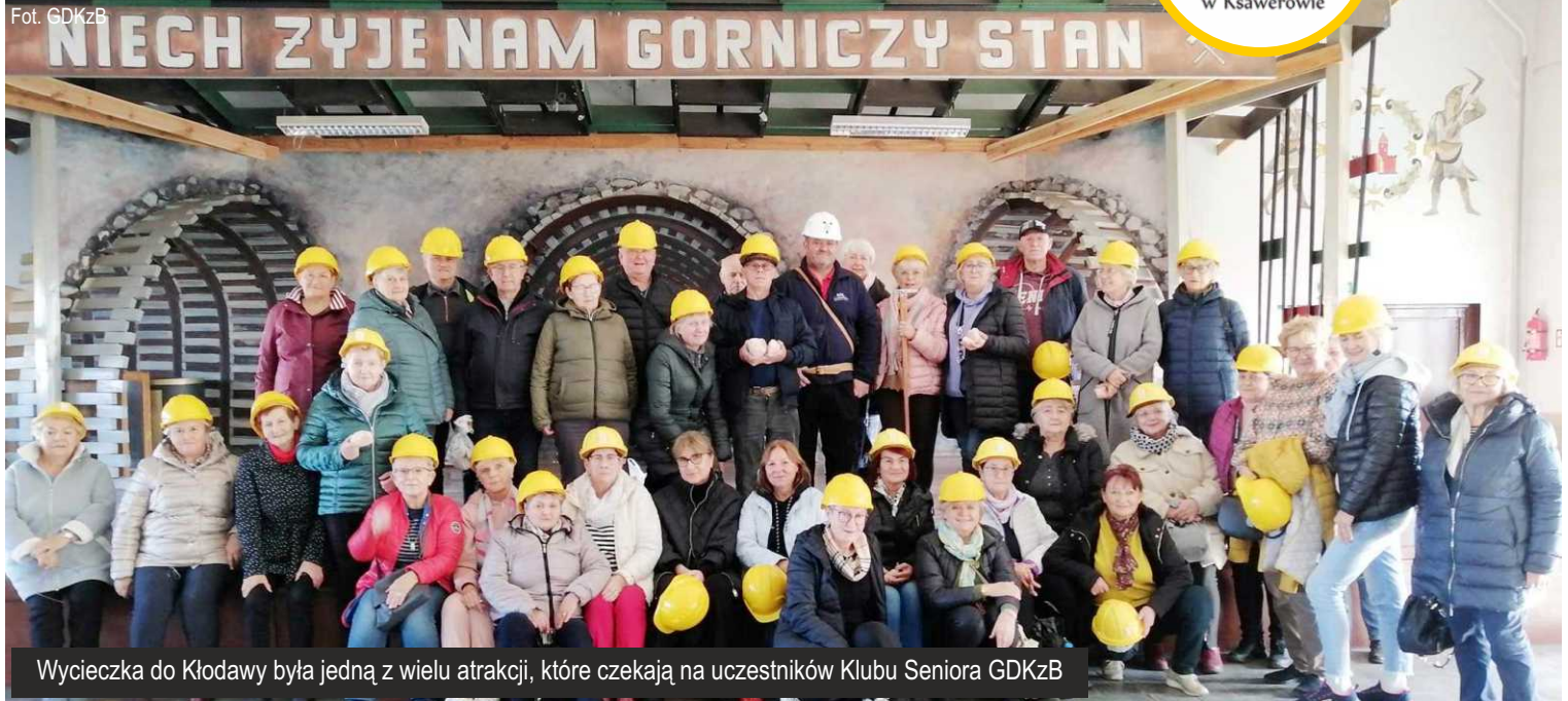
Wycieczka do Kłodawy była jedną z wielu atrakcji, które czekają na uczestników Klubu Seniora GDKzB

Nie Wieliczka czy Bochnia, ale właśnie kopalnia w Kłodawie jest największą i najgłębszą kopalnią soli w Polsce. Jest to także najmłodsza kopalnia, bo powstała w latach 50-tych XX w. To głównie z niej pochodzi sól jadalna oraz drogowa, a roczne wydobycie sięga miliona ton. 18 października br. nasi klubowicze z Klubu Seniora GDKzB w Ksawerowie mogli zwiedzić kopalnię, przemierzając najgłębszą w Polsce podziemną trasę turystyczną (600 metrów pod ziemią).