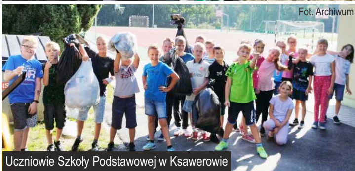
Uczniowie Szkoły Podstawowej w Ksawerowie