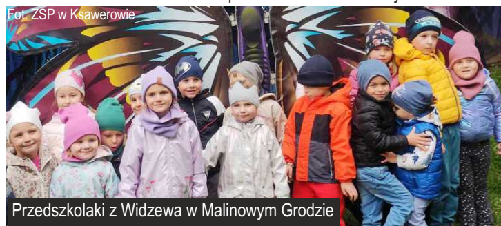
Przedшкоlaki z Widzewa w Malinowym Grodzie

Zespół Szkolno-Przedszkolny w Ksawerowie