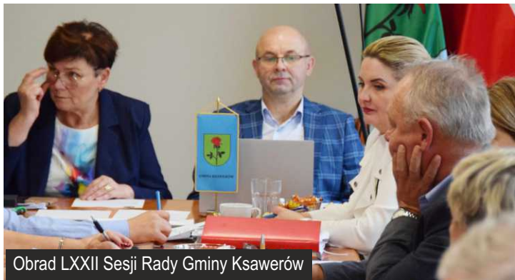
Obrad LXXII Sesji Rady Gminy Ksawerów

25 października br. w Urzędzie Gminy Ksawerów odbyła się LXXII Sesja Rady Gminy Ksawerów poprzedzona wspólnym posiedzeniem Komisji Budżetu, Gospodarki, Rolnictwa i Ochrony Środowiska oraz Komisji Samorządowo – Społecznej.