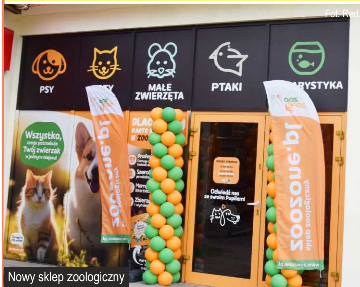
Nowy sklep zoologiczny

W centrum Ksawerowa, w sąsiedztwie pizzerii, otworzony został nowy sklep zoologiczny.