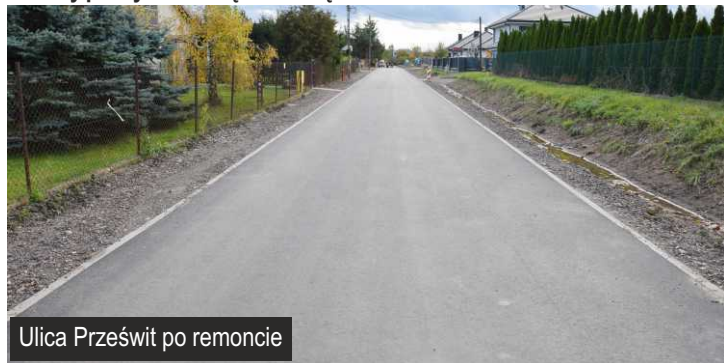
Ulica Prześwit po remoncie

W październiku zakończyły się prace budowlane w ul. Prześwit w Ksawerowie. Oprócz nowej nawierzchni asfaltowej zjazdy do posesji zostały pokryte kostką brukową.