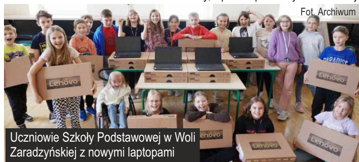
Uczniowie Szkoły Podstawowej w Woli Zaradzyńskiej z nowymi laptopami