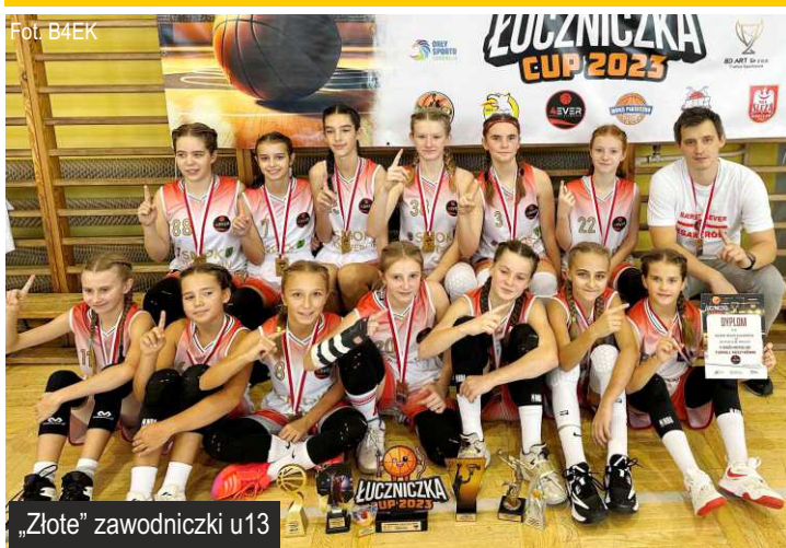
„Złote” zawodniczki u13

Ostatni, przedsezonowy turniej rozegrały zawodniczki u13. Bardzo mocno obsadzone zawody w Bydgoszczy miał być próbą generalną przed naszymi koszykarkami, które w tym sezonie upatrywane są w gronie zespołów walczących o złoty medal Mistrzostw Polski. Egzamin zdany celująco!