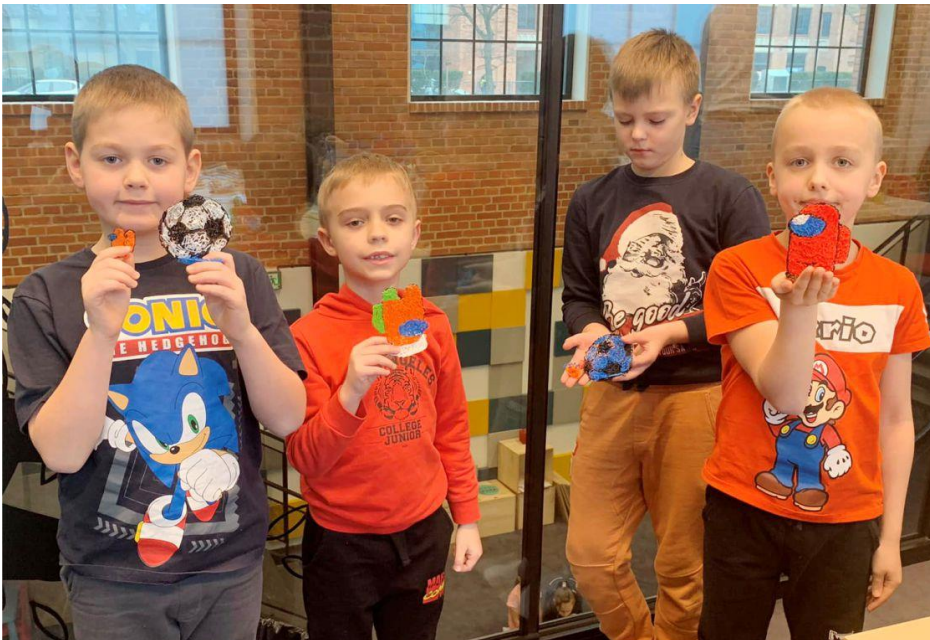
Fotografia przedstawia uczestników zimowych półkolonii. Fotografia jest archiwalna.