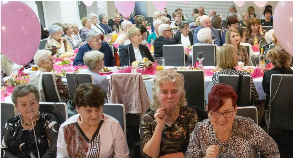
Fotografia przedstawia uczestników Babskiej Biesiady.