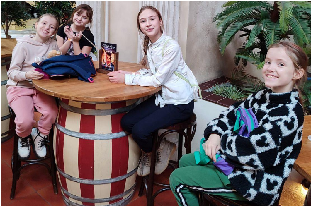
Fotografia przedstawia uczestników zimowych półkolonii. Fotografia jest archiwalna.