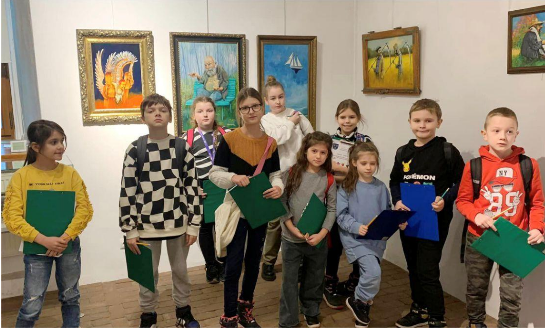
Fotografia przedstawia uczestników zimowych półkolonii. Fotografia jest archiwalna.