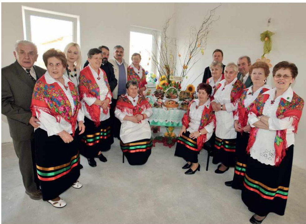
Fotografia przedstawia gospodynie z KGW w Ksawerowie (2014 rok). Informacje pochodzi z monografii gminy Ksawerów.