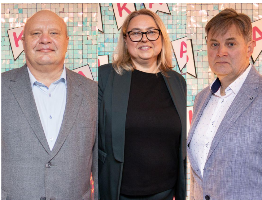
Fotografia przedstawia laureatów drugiego miejsca w konkursie.