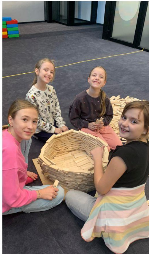
Fotografia przedstawia uczestników zimowych półkolonii. Fotografia jest archiwalna.