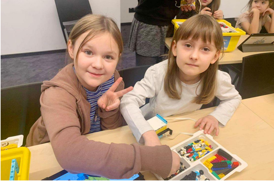
Fotografia przedstawia uczestników zimowych półkolonii. Fotografia jest archiwalna.