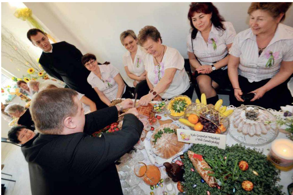
Fotografia przedstawia gospodynie z KGW w Woli Zaradzyńskiej (2012 rok).