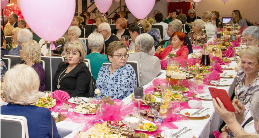
Fotografia przedstawia uczestników Babskiej Biesiady.