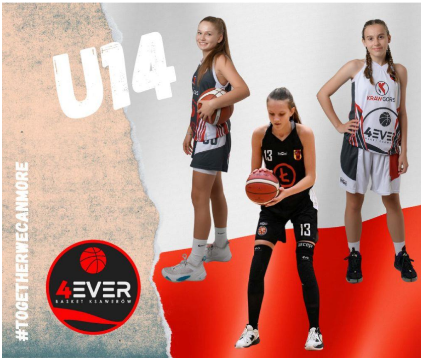
Fotografia przedstawia koszykarki powołane do reprezentacji. Fotografia jest archiwalna. Informację przygotował Basket 4Ever Ksawerów.