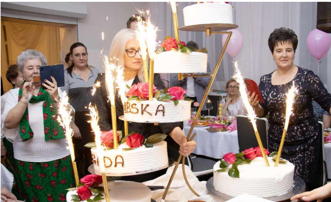
Fotografia przedstawia uczestników Babskiej Biesiady. Fotografie wykonała redakcja. Informację przygotował Referat Oświaty, Spraw społecznych i Promocji.