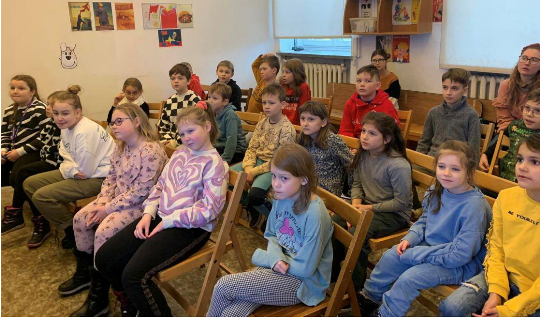
Fotografia przedstawia uczestników zimowych półkolonii. Fotografia jest archiwalna.