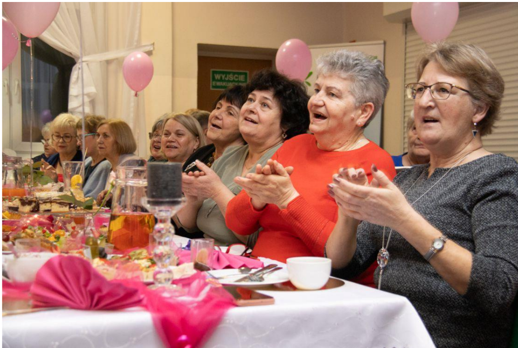
Fotografia przedstawia uczestników Babskiej Biesiady. Fotografiją wykonała redakcja.