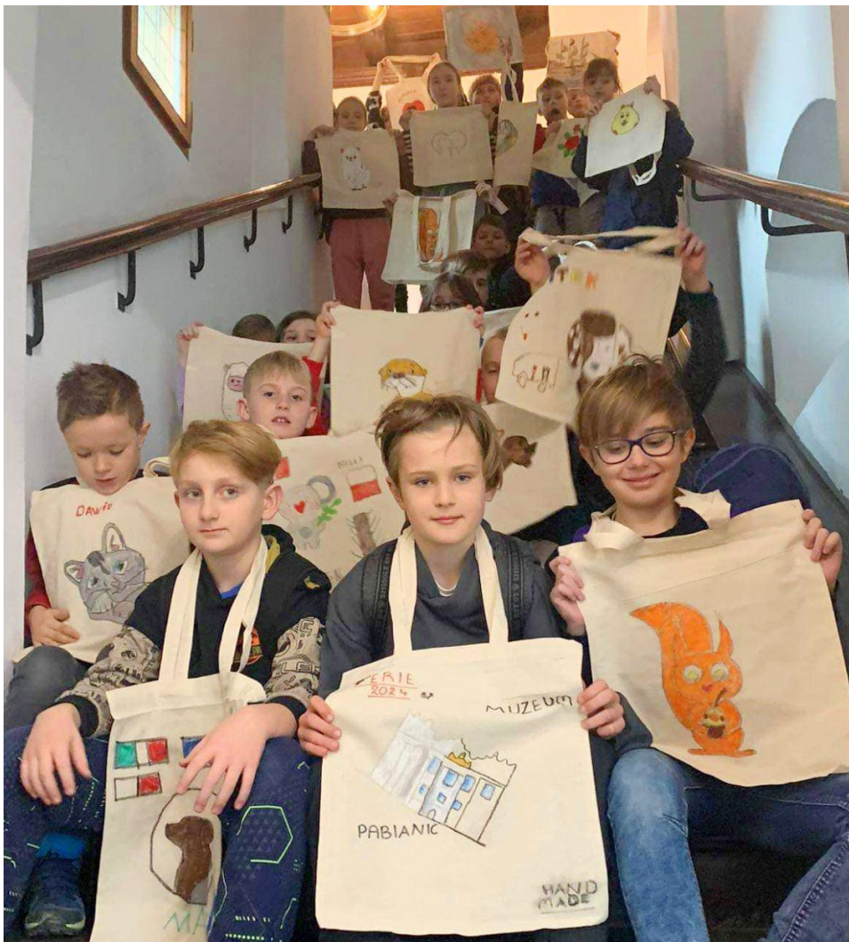
Fotografia przedstawia uczestników zimowych półkolonii. Fotografia jest archiwalna.