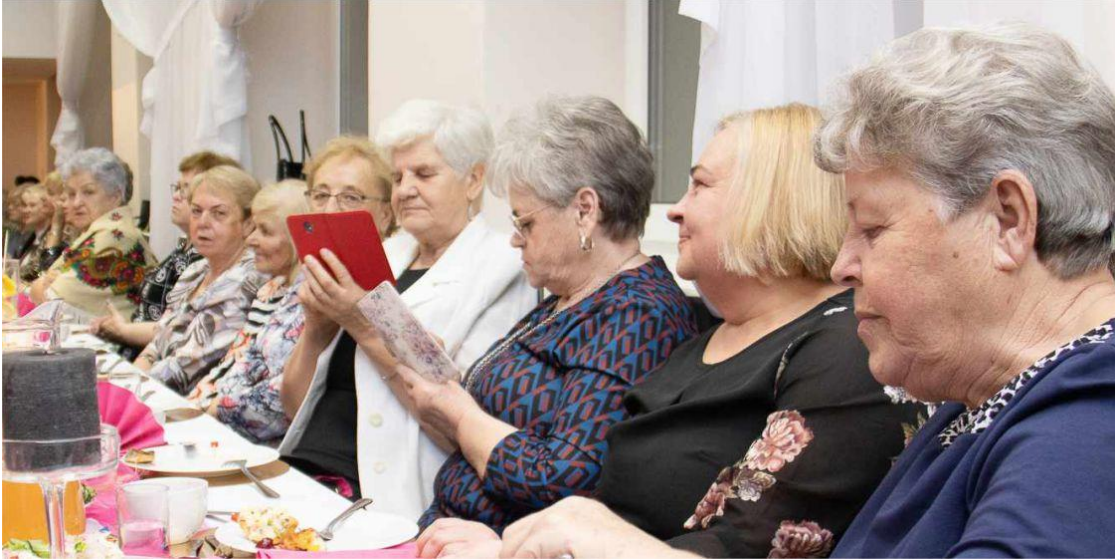
Fotografia przedstawia uczestników Babskiej Biesiady.