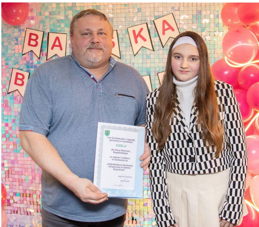
Fotografia przedstawia laureatów pierwszego miejsca w konkursie.