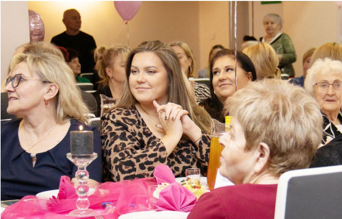
Fotografia przedstawia uczestników Babskiej Biesiady.