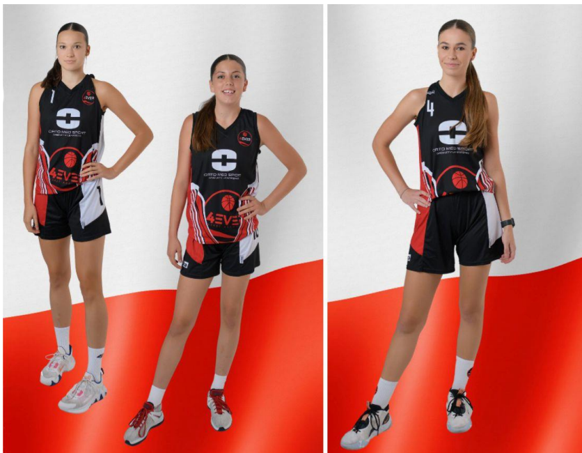
Fotografia przedstawia koszykarki powołane do reprezentacji. Fotografia jest archiwalna. Informację przygotował Basket 4Ever Ksawerów.