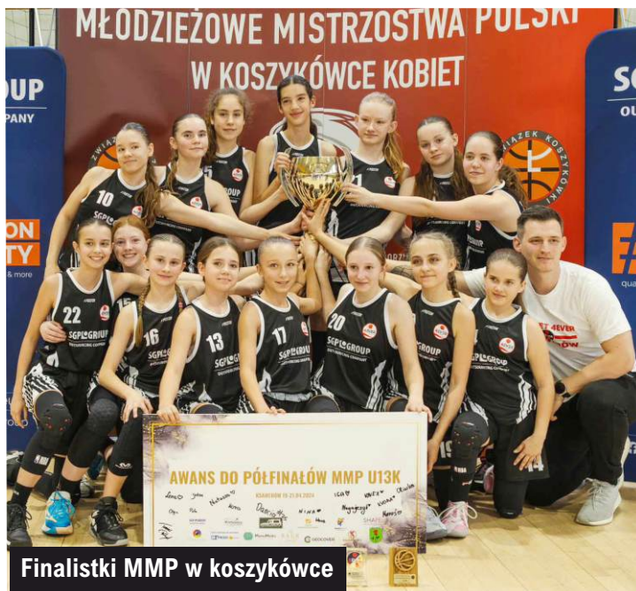
Finalistki MMP w koszykówce

Rejestracja na turniej ruszy już niebawem, a sama rywalizacja odbędzie się w dniach 15-16 czerwca na specjalnie przygotowanych boiskach, rozłożonych na parkingu CH Tkalinia.