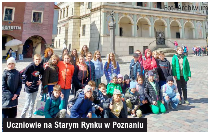
Uczniowie na Starym Rynku w Poznaniu