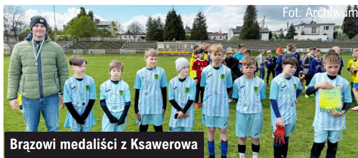
Brązowi medaliści z Ksawerowa