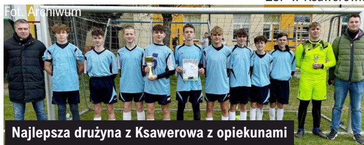
Najlepsza drużyna z Ksawerowa z opiekunami