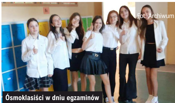
Ósmoklasiści w dniu egzaminów

Referat Oświaty, Spraw Społecznych i Promocji