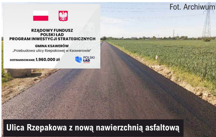
Ulica Rzepakowa z nową nawierzchnią asfaltową

Wykonawca inwestycji (firma Włodan) ułożył drugą warstwę bitumiczną – warstwę wiążącą. W następnym etapie planowane są prace odnośnie regulacji wysokościowych studzienek przed ułożeniem warstwy ścieralnej.