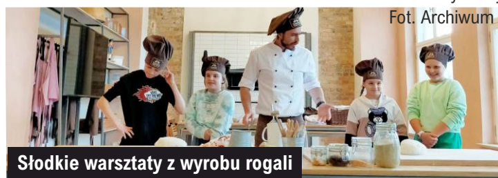
Słodkie warsztaty z wyrobu rogali