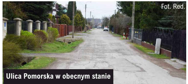
Ulica Pomorska w obecnym stanie

Dla ww. zadań gmina przeprowadziła już postępowania przetargowe i ma podpisane umowy z Wykonawcą robót, firmą Włodan, która złożyła najkorzystniejsze oferty w obu postępowaniach. Na realizację zadań Wykonawca ma czas do października br.