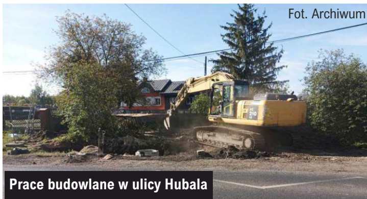
Prace budowlane w ulicy Hubala

W ul. Hubala trwa budowa sieci kanalizacyjnej. Inwestycję, która realizowana jest w ramach zadania „Rozbudowa sieci wodociągowo - kanalizacyjnej na terenie gminy Ksawerów” wykonuje firma JONTEX.