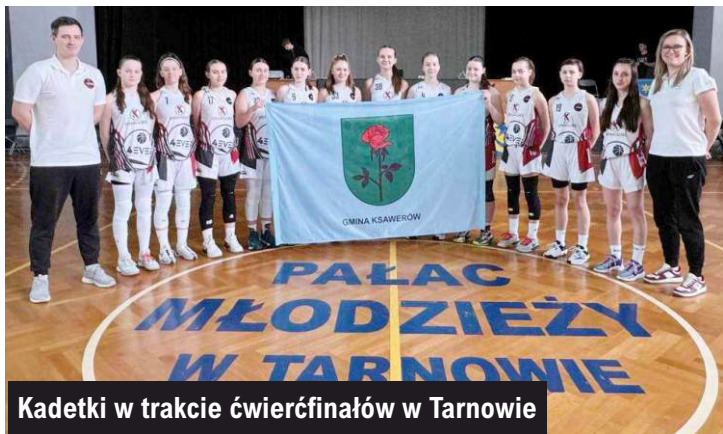
Kadetki w trakcie ćwierćfinałów w Tarnowie

Ogromne brawa dla wszystkich zawodniczek, które z pełnym zaangażowaniem reprezentowały Ksawerów!