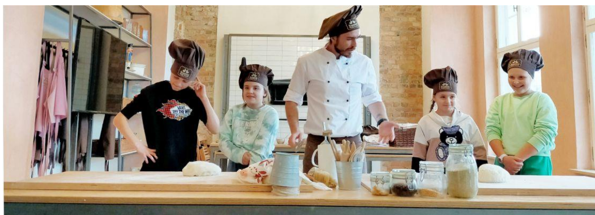
Zdjęcie przedstawia uczniów podczas warsztatów kulinarnych. Zdjęcie jest archiwalne. Informację przygotowała Szkoła Podstawowa w Woli Zaradzyńskiej.