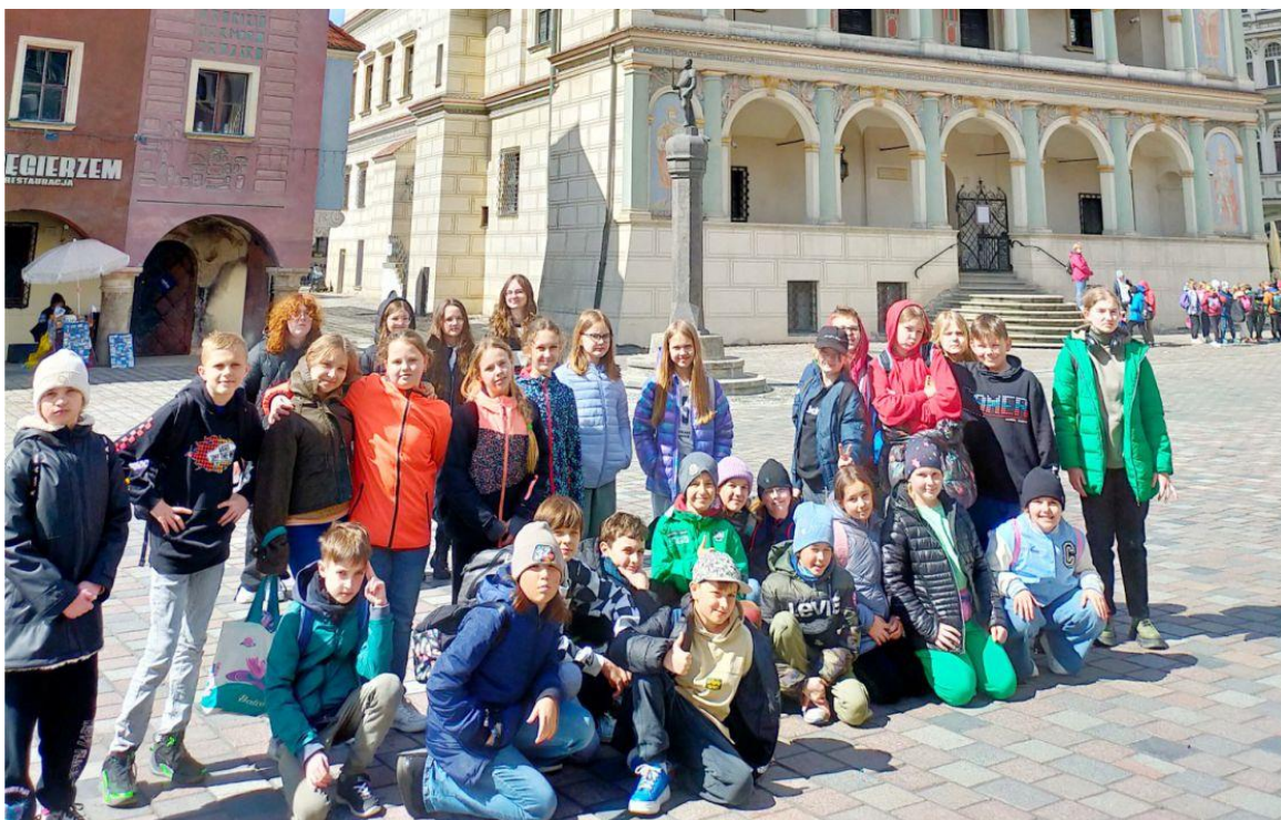
Zdjęcie przedstawia uczniów na Starym Rynku w Poznaniu. Fotografia jest archiwalna.

Następnie wszyscy udali się na zwiedzanie Starego Miasta. Tutaj podziwiali ratusz, piękne kamieniczki, fontannę Prozerpiny oraz pokaz ruchomych figurek koziołków. Na koniec uczniowie wzięli udział w słodkich warsztatach wyrobu słynnych poznańskich rogali świętomarcińskich. Wszyscy tego dnia wspaniale się bawili i wrócili do domu w dobrym humorze.