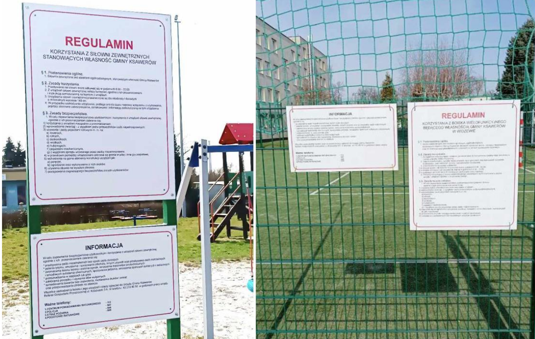
Fotografia przedstawia nowe regulaminy korzystania z obiektów. Zdjęcie jest archiwalne.