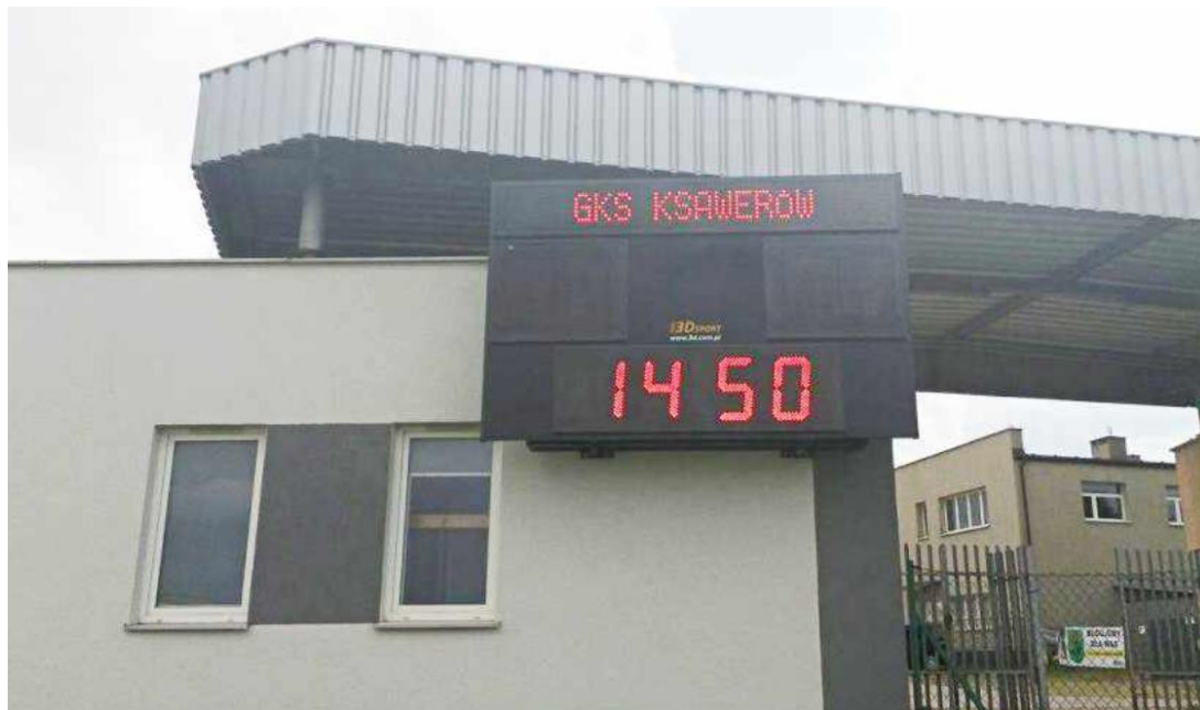
Fotografia przedstawia tablicę wyników zamontowaną na Stadionie Gminy Ksawerów w Woli Zaradzyńskiej. Zdjęcie jest archiwalne. Informację przygotował Referat Infrastruktury.