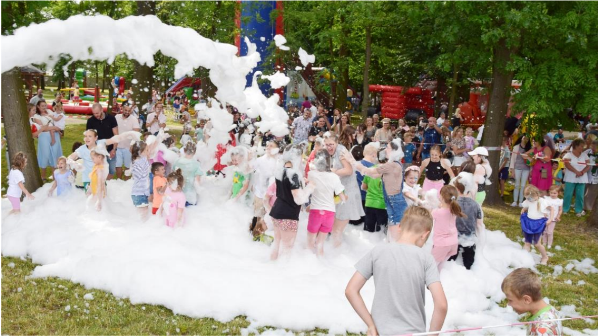
Fotografia przedstawia osoby uczestniczące w piana party.