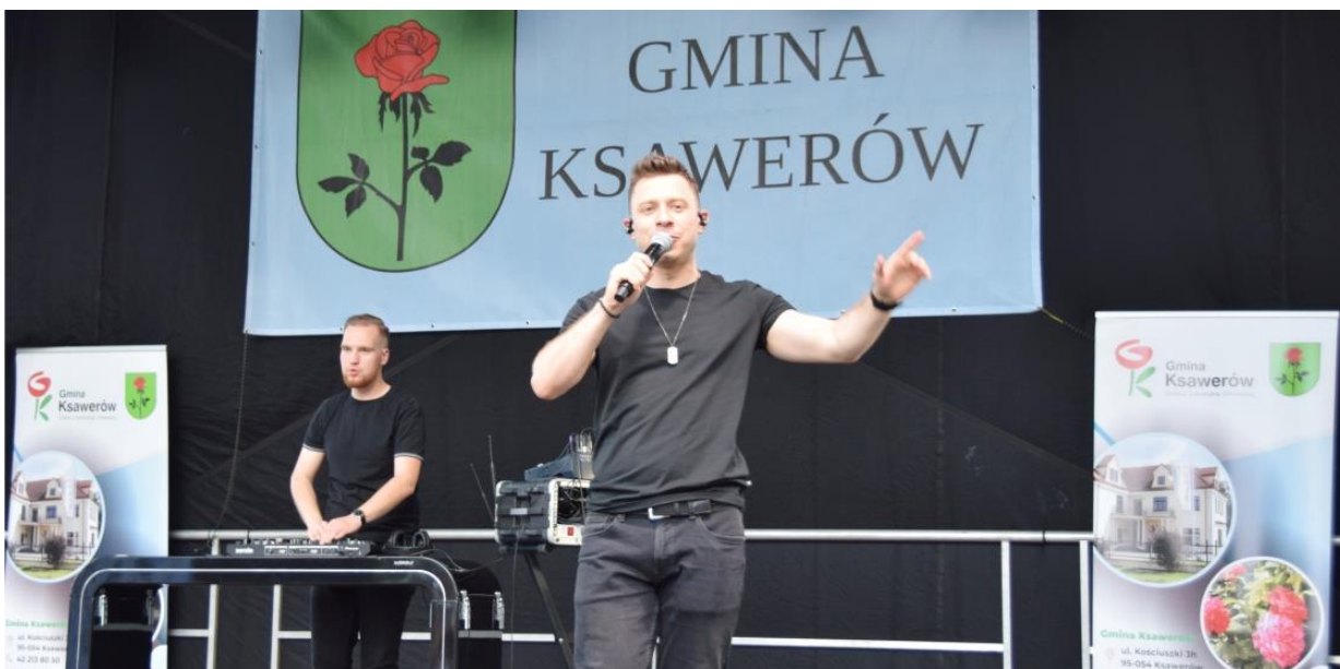
Fotografia przedstawia gwiazdę wieczoru – zespół Masters. Zdjęcie wykonała redakcja. . Informację przygotował Referat Oświaty, Spraw Społecznych i Promocji.