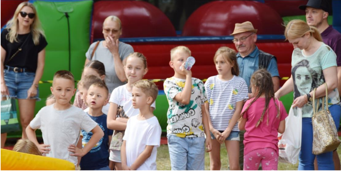
Fotografia przedstawia dzieci uczestniczące w festynie. Zdjęcie wykonała redakcja.