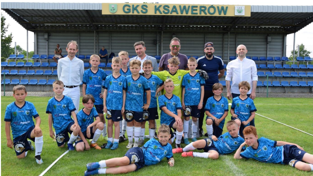
Fotografia przedstawia drużynę GKS Ksawerów z trenerami, działaczami i wóldarzami gminy Ksawerów. Fotografie wykonała redakcja