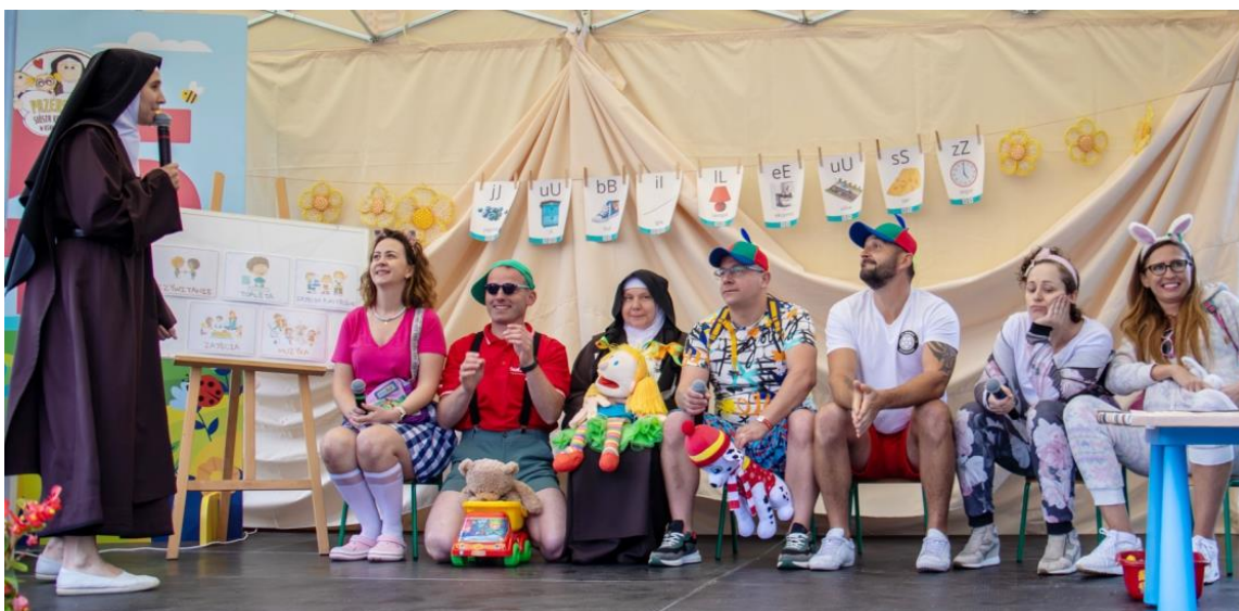
Fotografia przedstawia uczestników uroczystości – występ artystyczny rodziców podczas pikniku na terenie przedszkola.