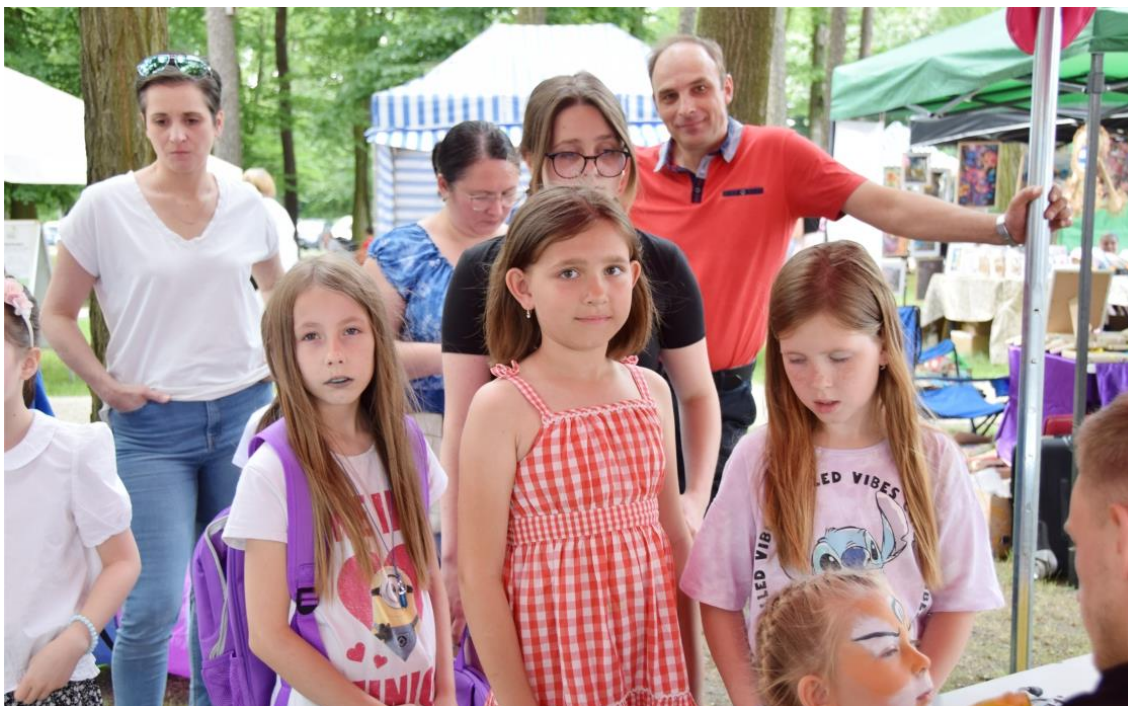
Fotografia przedstawia osoby uczestniczące w festynie.