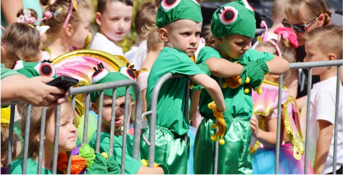
Fotografia przedstawia dzieci uczestniczące w festynie.