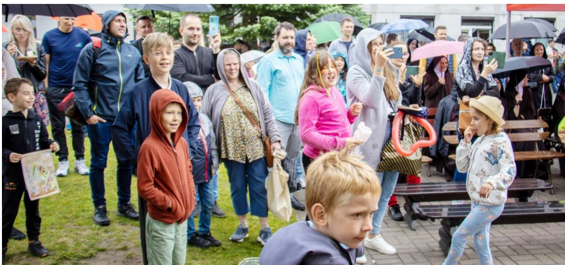
Fotografia przedstawia uczestników uroczystości podczas pikniku na terenie przedszkola.