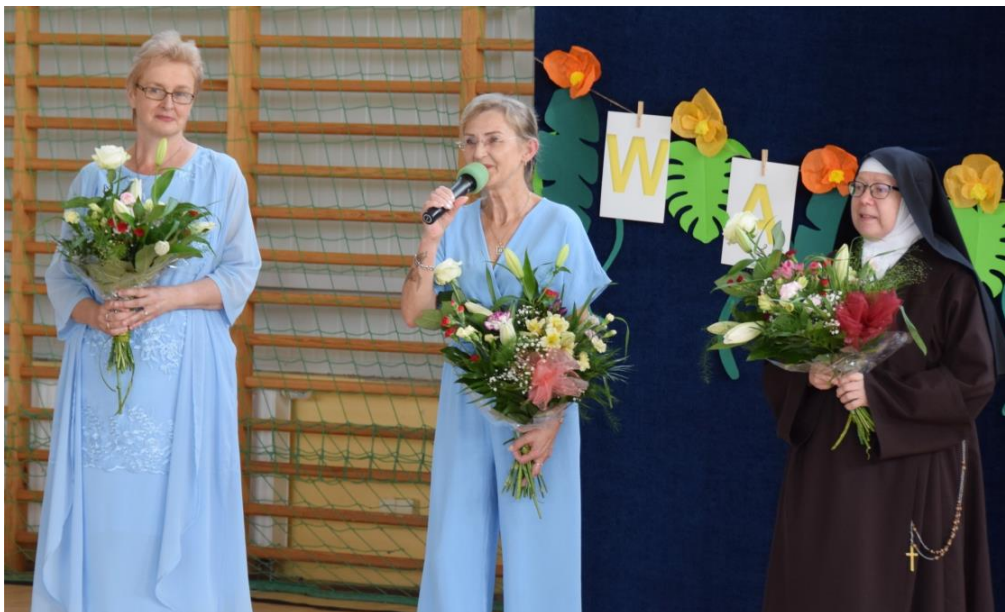
Fotografia przedstawia nauczycieli Zespołu Szkolno-Przedszkolnego w Ksawerowie odchodzących na emeryturę.