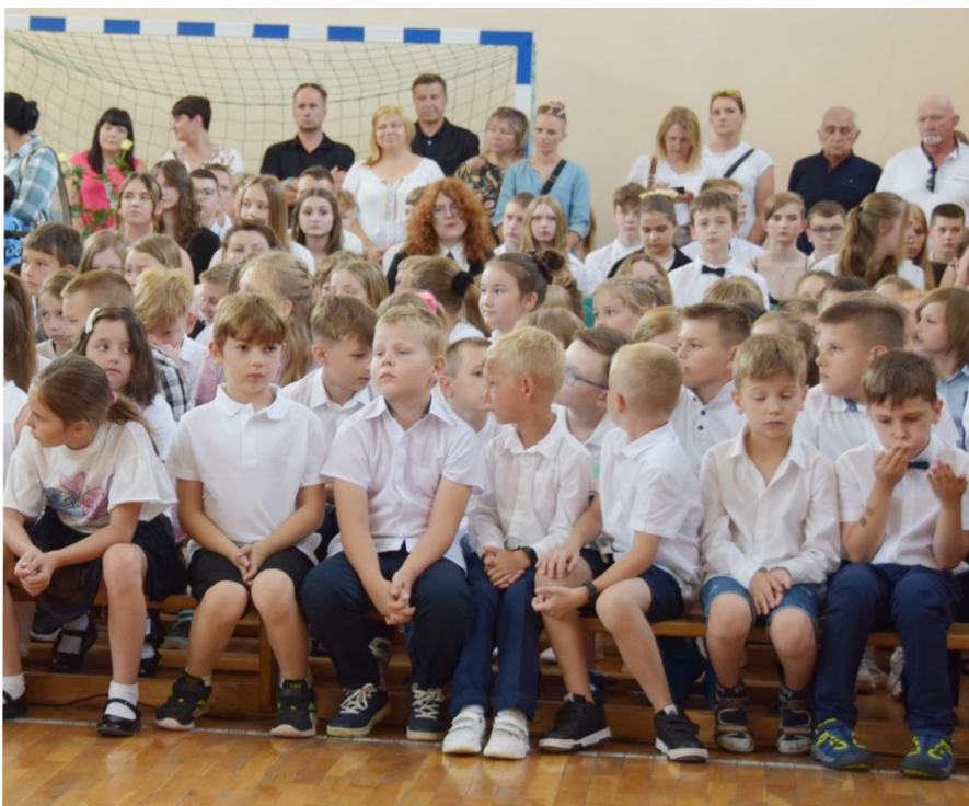
Fotografia przedstawia dzieci ze Szkoły Podstawowej w Woli Zaradzyńskiej uczestniczące w uroczystości zakończenia roku szkolnego.