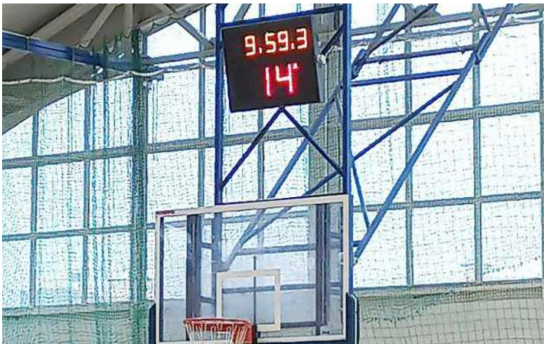
Fotografia przedstawia tablicę wyników zamontowaną w hali sportowej w Ksawerowie. Zdjęcie jest archiwalne.