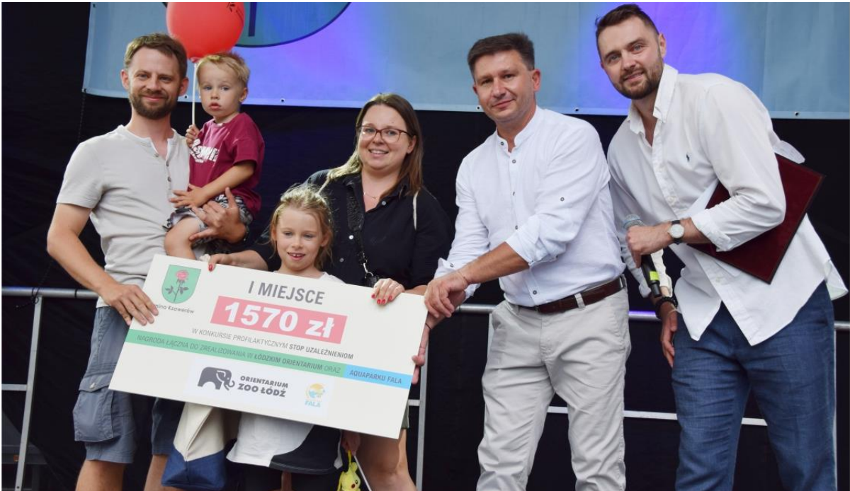
Fotografia przedstawia laureatów konkursu profilaktycznego STOP UZALEŻNIENIOM.