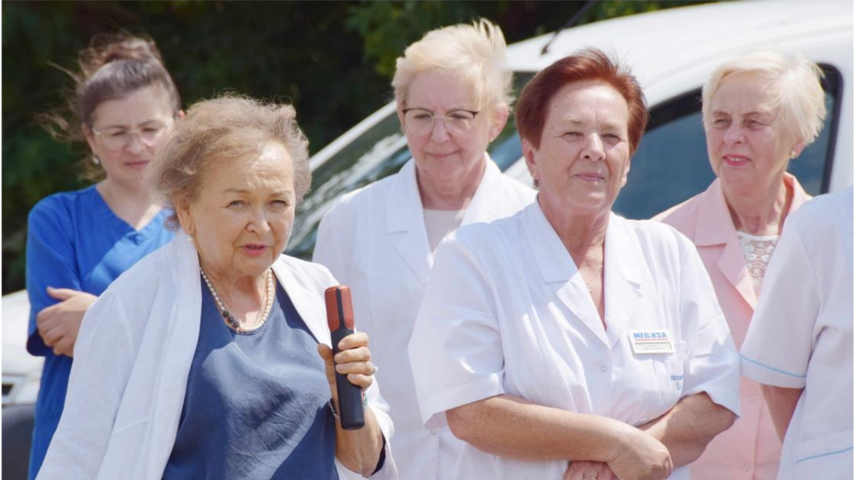
Fotografia przedstawia pracowników ośrodka zdrowia MEDiKSA w Ksawerowie.