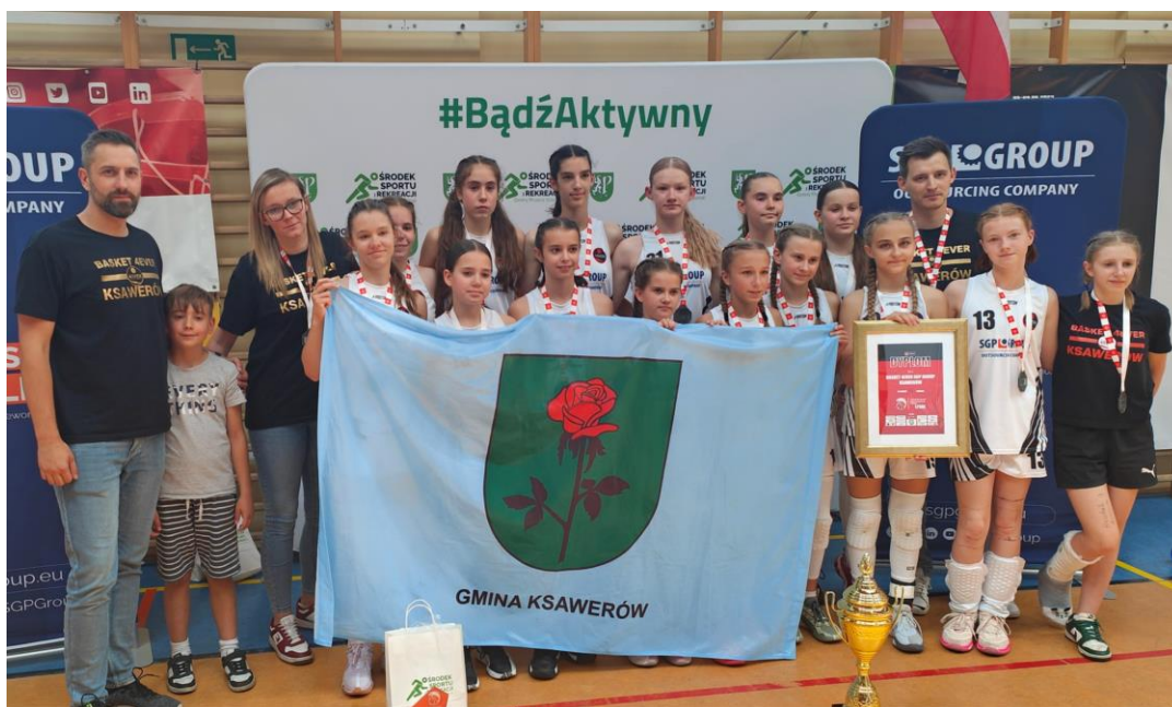
Fotografia przedstawia koszykarki – wicemistrzynię Polski, ze sztabem szkoleniowym. Fotografia jest archiwalna.