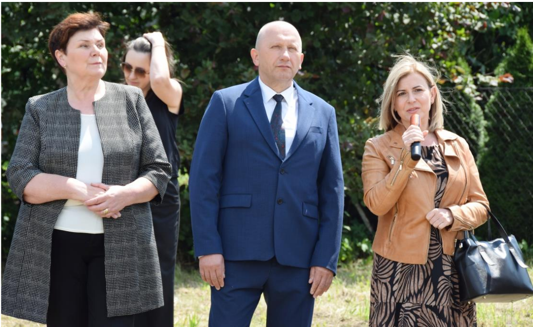
Fotografia przedstawia osoby uczestniczące w uroczystej inauguracji budowy. Zdjęcie wykonała redakcja. Informację przygotował Referat Oświaty, Spraw Społecznych i Promocji.