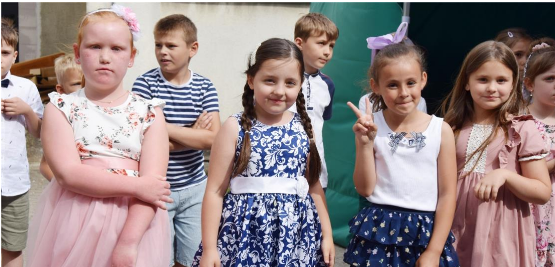
Fotografia przedstawia dzieci uczestniczące w festynie.