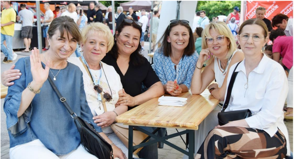
Fotografia przedstawia uczestniczki Festynu Gminnego.