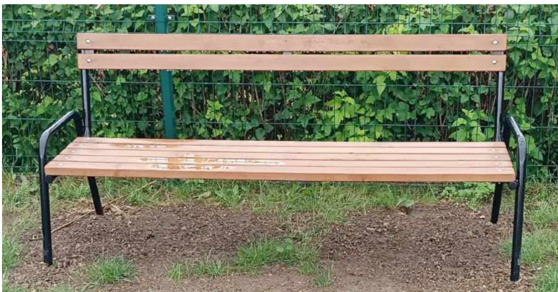
Fotografia przedstawia wyremontowaną ławkę. Zdjęcie jest archiwalne.