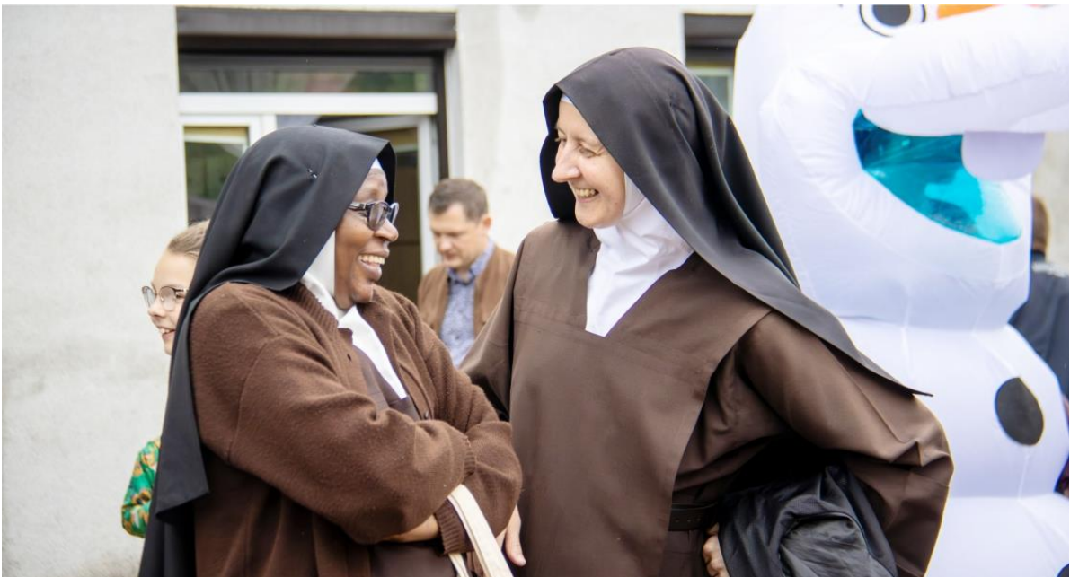
Fotografia przedstawia siostry Karmelitanki. Informację przygotował Referat Oświaty, Spraw Społecznych i Promocji.