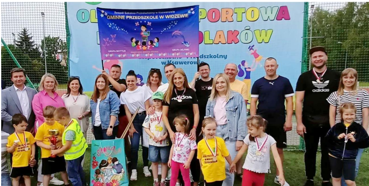
Fotografia przedstawia uczestników olimpiady. Fotografia jest archiwalna.