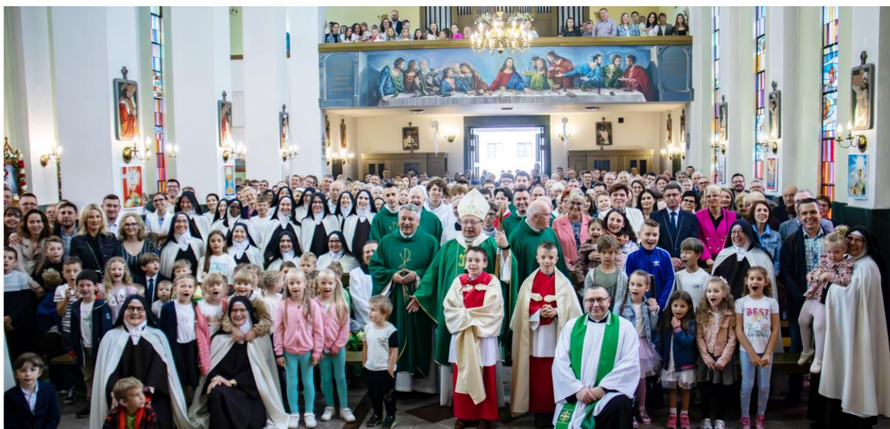
Fotografia przedstawia uczestników uroczystej, jubileuszowej mszy świętej. Zdjęcie wykonała redakcja.

Życzymy naszym siostram dalszych sukcesów wychowawczych i opiekuńczych!