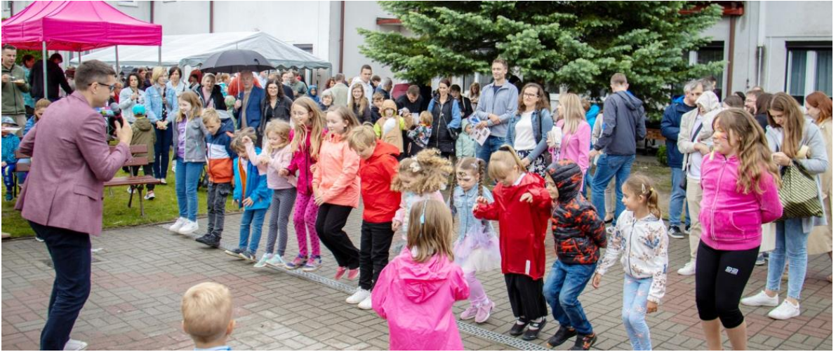
Fotografia przedstawia uczestników uroczystości podczas pikniku na terenie przedszkola.