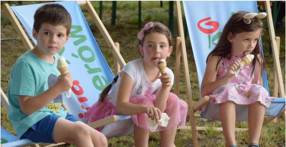
Fotografia przedstawia dzieci uczestniczące w festynie.