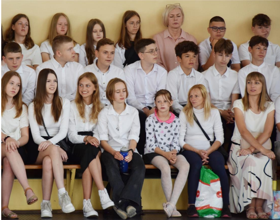
Fotografia przedstawia uczniów Zespołu Szkolno-Przedszkolnego w Ksawerowie podczas uroczystości zakończenia roku szkolnego. Zdjęcie wykonała redakcja.