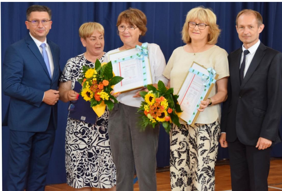
Fotografia przedstawia nauczycieli Szkoły Podstawowej w Woli Zaradzyńskiej odchodzących na emeryturę, na zdjęciu z wóldarzami gminy.