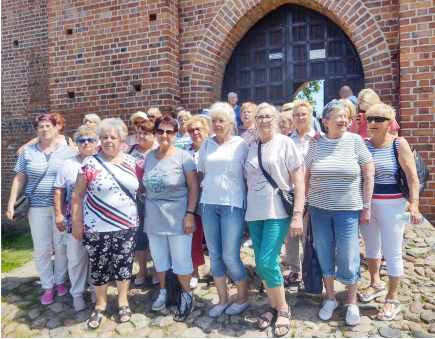
Fotografia przedstawia seniorów podczas jednej z wycieczek. Zdjęcie jest archiwalne.