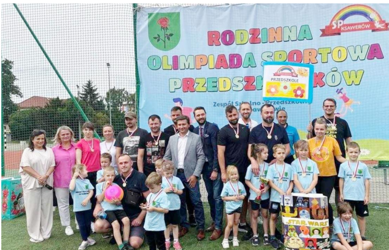
Fotografia przedstawia uczestników olimpiady. Fotografia jest archiwalna.