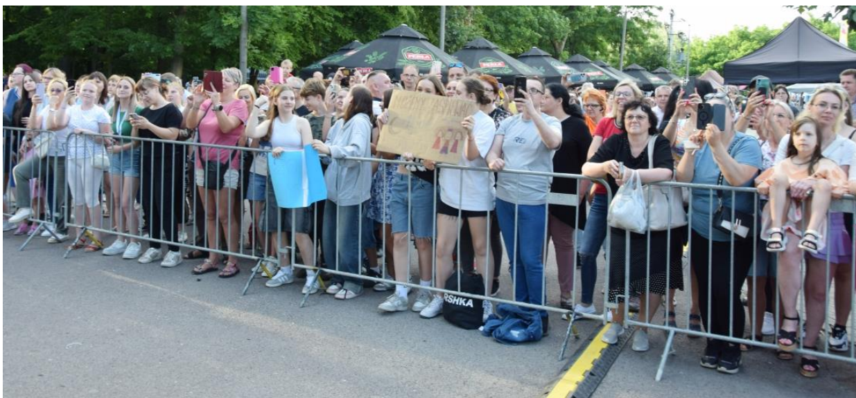
Fotografia przedstawia osoby uczestniczące w festynie.