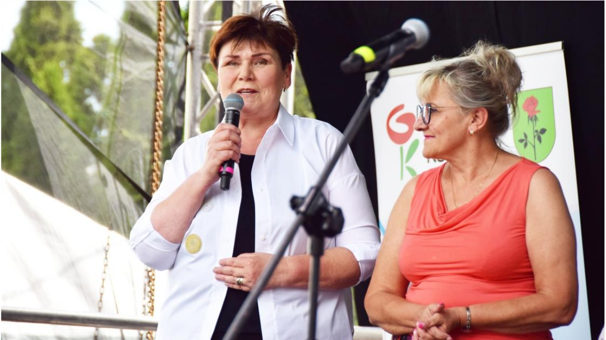
Fotografia przedstawia radne gminy Ksawerów witające uczestników uroczystości.