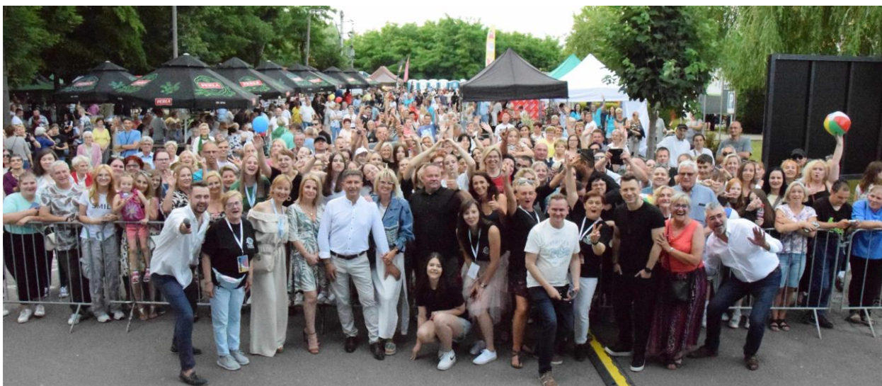
Fotografia przedstawia uczestników festynu.

Dziękujemy wszystkim mieszkańcom oraz innym gościom za obecność i współtworzenie tego wyjątkowego dnia. Do zobaczenia za rok!