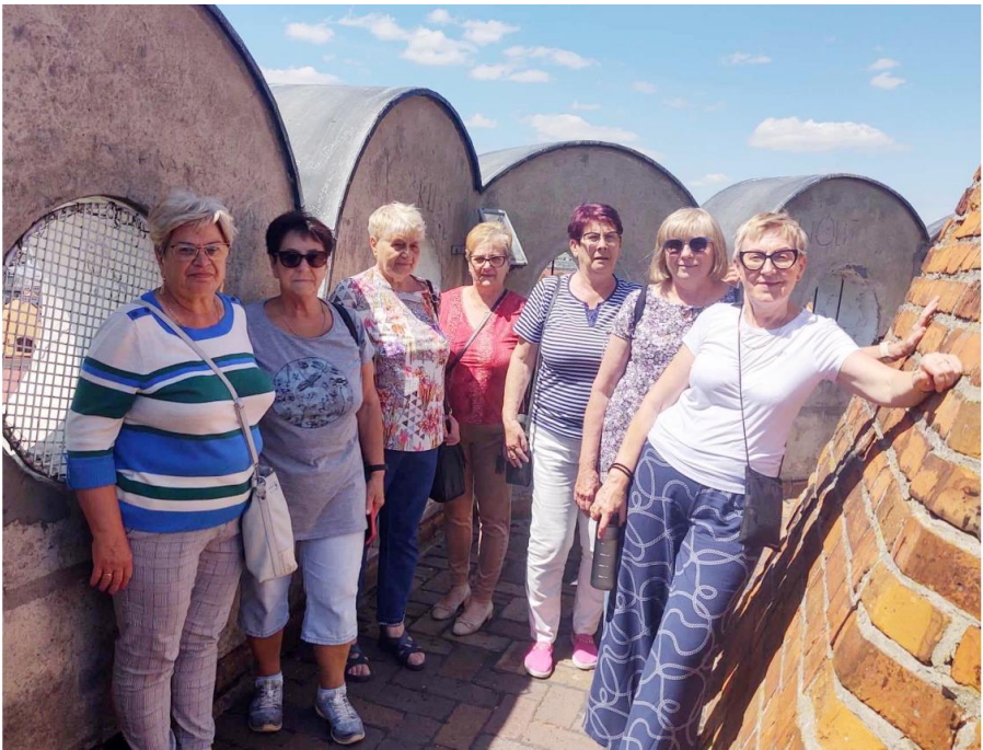
Fotografia przedstawia seniorów podczas jednej z wycieczek. Zdjęcie jest archiwalne.