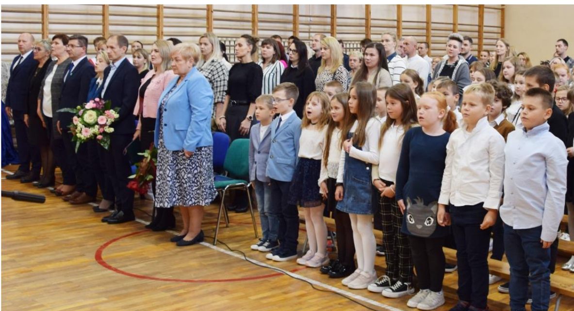
Zdjęcie przedstawia uczniów podczas uroczystości w Szkole Podstawowej w Woli Zaradzyńskiej.