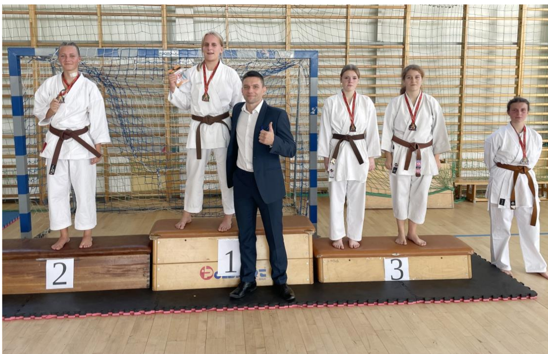
Zdjęcie przedstawia nagrodzonych karateków podczas turnieju. Zdjęcie jest archiwalne. Informację przygotowała redakcja.