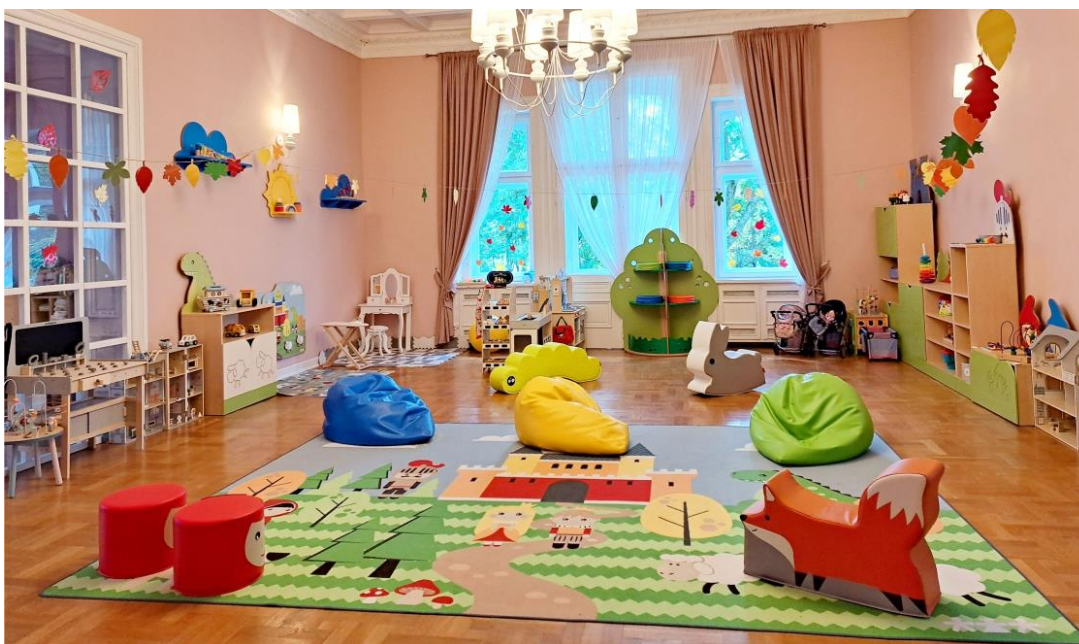
Zdjęcie przedstawia salę zabaw w żłobku. Fotografia jest archiwalna.

Przypominamy o możliwości skorzystania z dofinansowania do czesnego w żłobku, w wysokości 1500 zł miesięcznie w ramach kolejnego rządowego programu "AKTYWNY RODZIC" (patrz str.9). Szczegóły dotyczące nadchodzących kolejnych, gminnych ulg dla rodziców w związku z zapisem dzieci do żłobka, już w kolejnym wydaniu gazety.