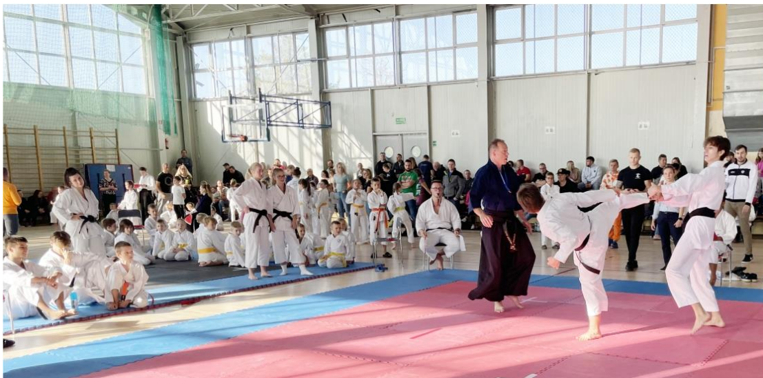
Zdjęcie przedstawia karateków podczas turnieju. Zdjęcie jest archiwalne.

brązowych i czarnych pasów była bezkonkurencyjna, zdobywając złote medale zarówno w kata, jak i kumite.