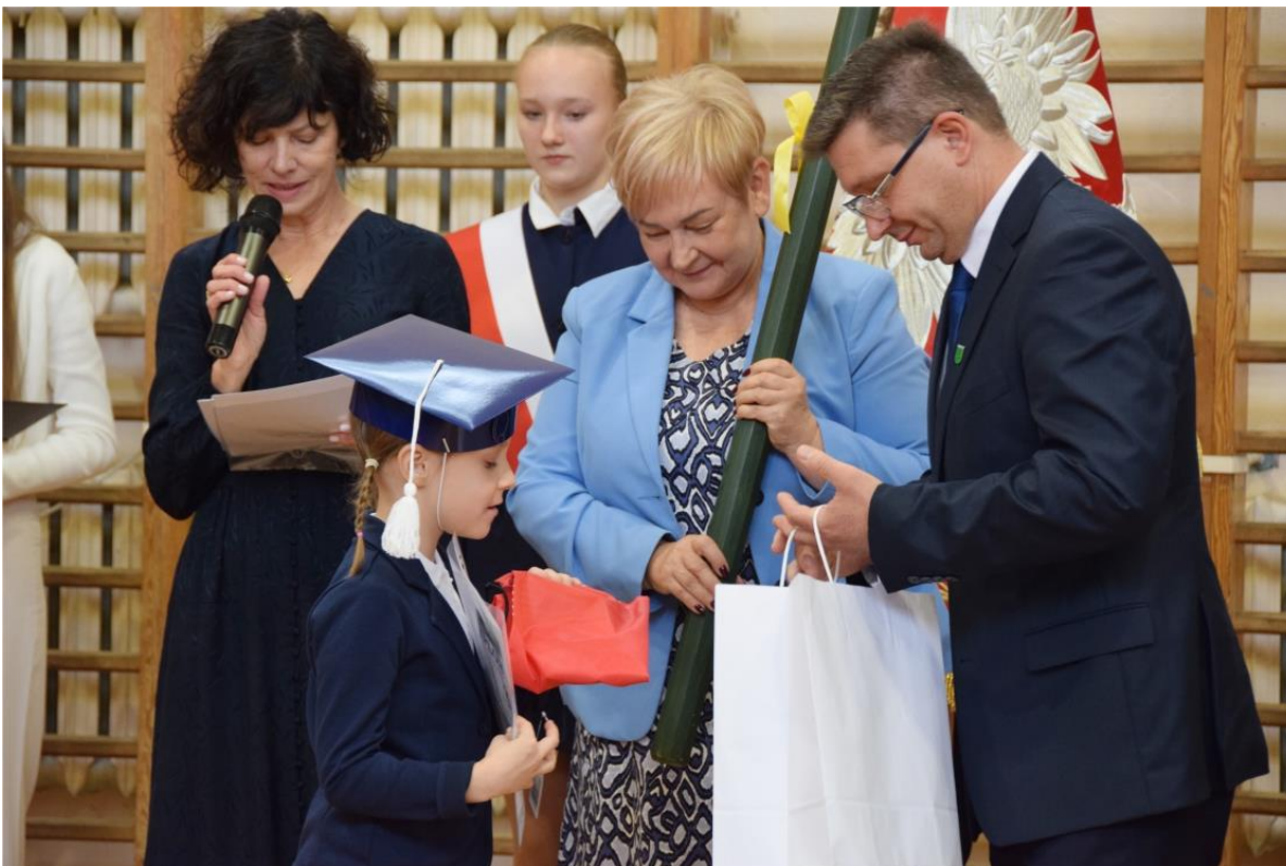
Zdjęcie przedstawia pasowanie ucznia pierwszoklasistę w Szkole Podstawowej w Woli Zaradzyńskiej.