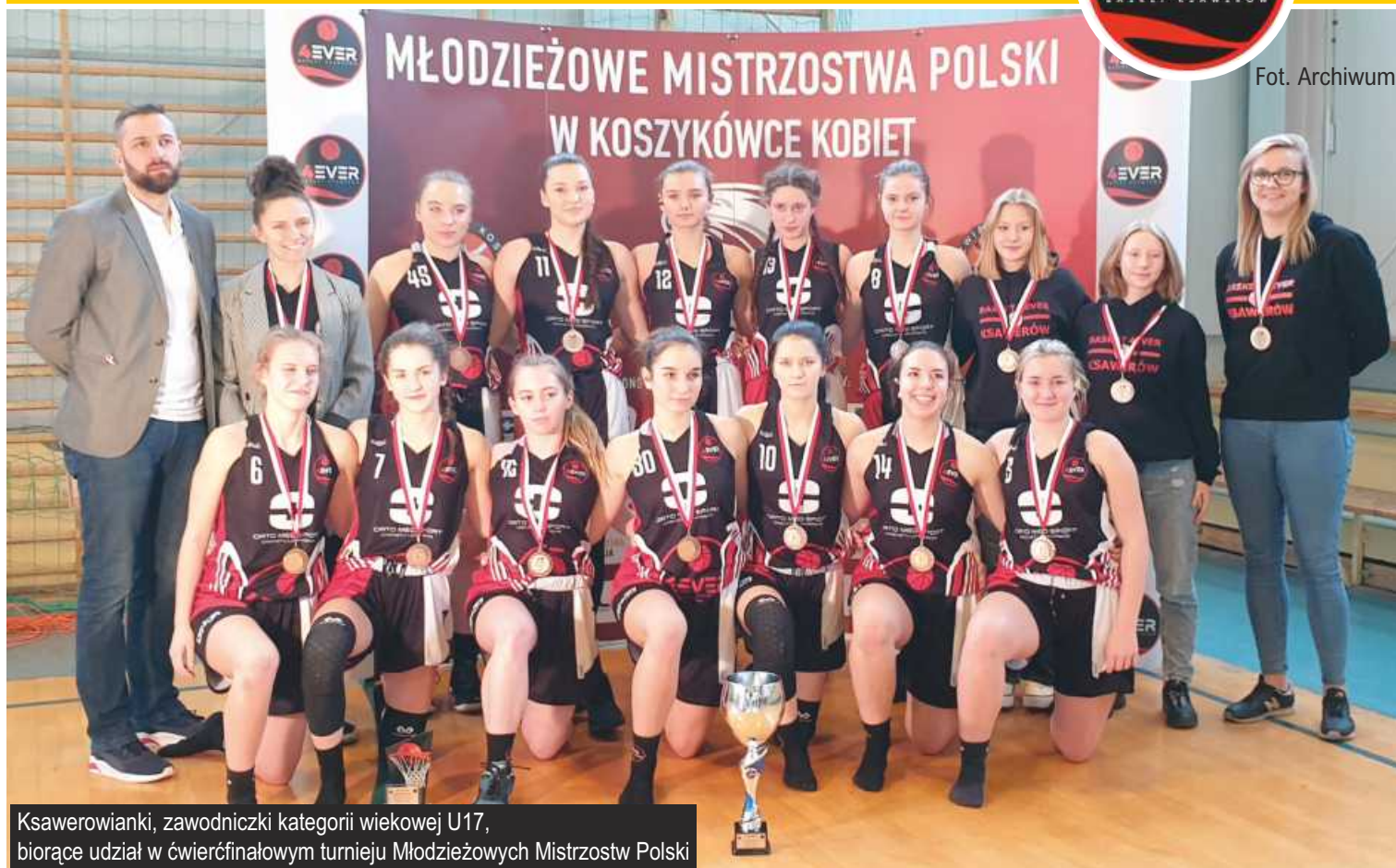
Ksawerowianki, zawodniczki kategorii wiekowej U17, biorące udział w ćwierćfinałowym turnieju Młodzieżowych Mistrzostw Polski

W dniach 14-16 stycznia 2022 roku w Ksawerowie odbył się turniej ćwierćfinałowy Młodzieżowych Mistrzostw Polski z udziałem trzech drużyn: Bogdanki UMCS AZS Lublin, MOSiR-u Bochnia oraz naszego zespołu z Ksawerowa - Basket 4EVER Liceum Sportowe Pabianice.