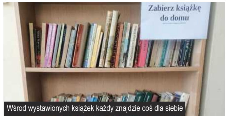
Wśród wystawionych książek każdy znajdzie coś dla siebie