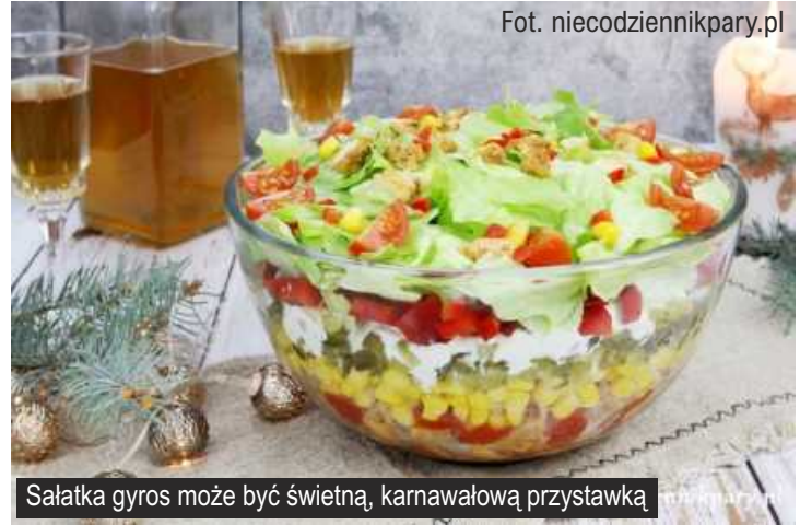
Salatka gyros może być świetną, karnawałową przystawką

Salatka gyros jest pyszną, wielowarstwową przekąską w sam raz na karnawałowe przyjęcie. Wygląda świetnie, a smakuje jeszcze lepiej!