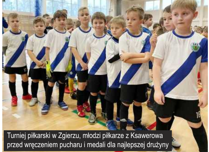
Turniej piłkarski w Zgierzu, młodzi piłkarze z Ksawerowa przed wręczeniem pucharu i medali dla najlepszej drużyny