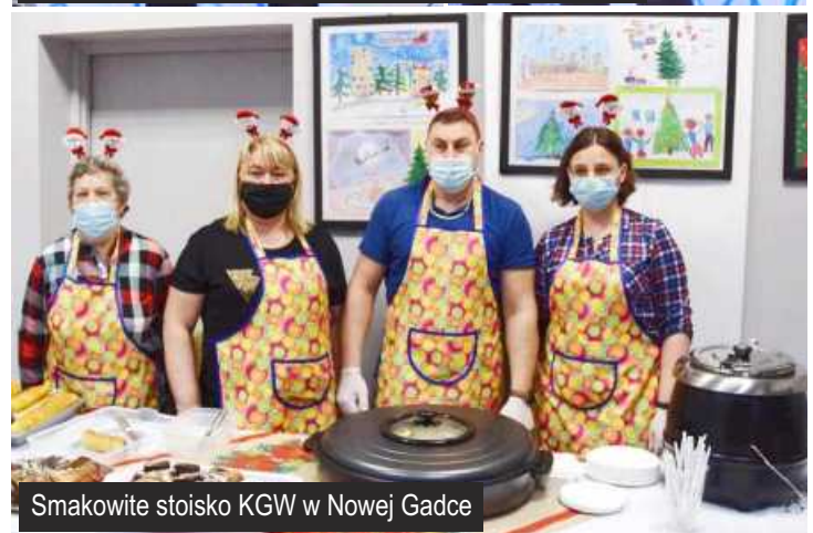
Smakowite stoisko KGW w Nowej Gadce