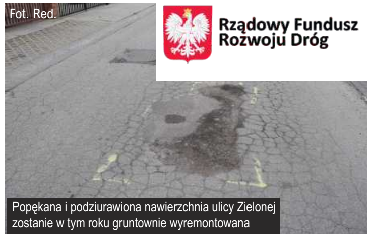
Popękana i podziurawiona nawierzchnia ulicy Zielonej zostanie w tym roku gruntownie wyremontowana