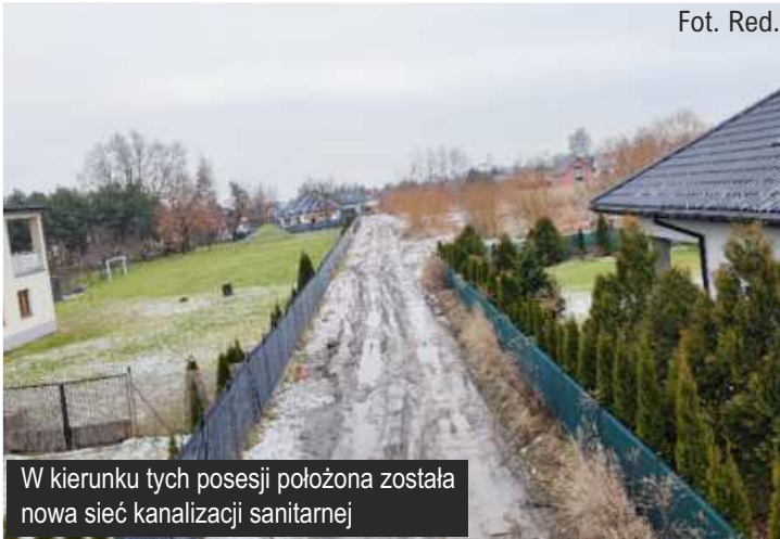
W kierunku tych posesji położona została nowa sieć kanalizacji sanitarnej