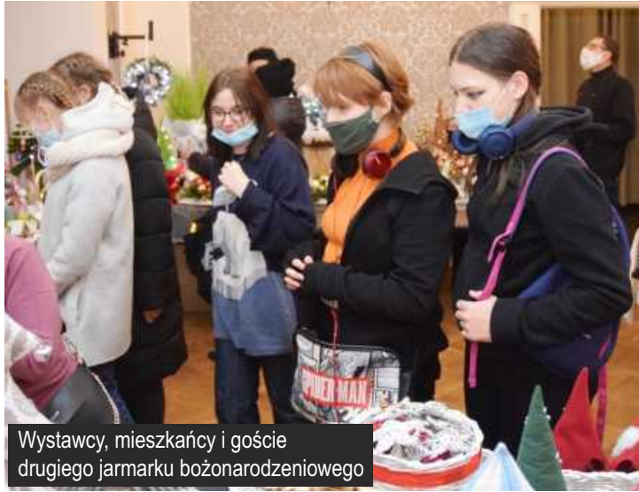
Wystawcy, mieszkańcy i goście drugiego jarmarku bożonarodzeniowego