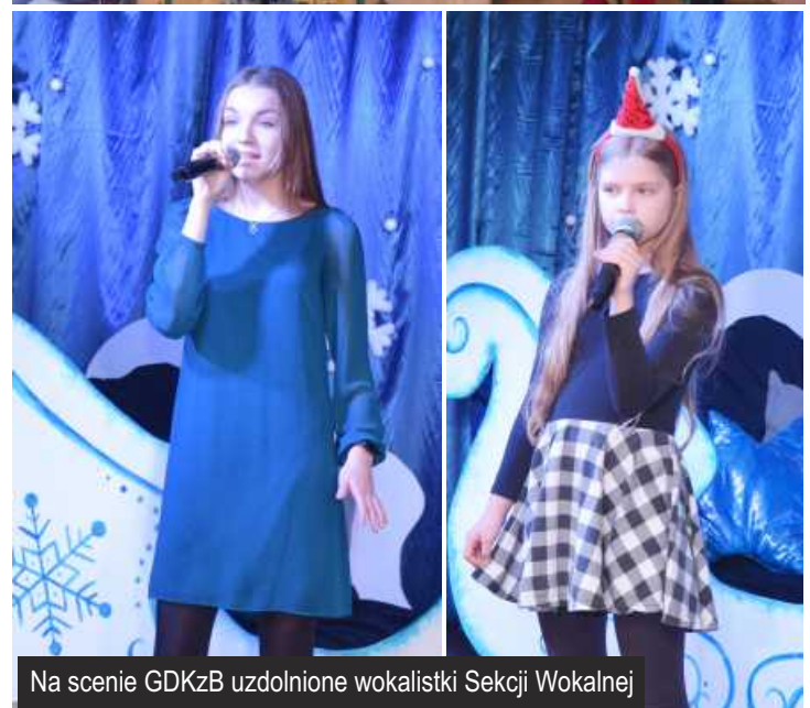
Na scenie GDKzB uzdolnione wokalistki Sekcji Wokalnej