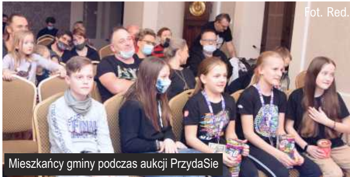
Mieszkańcy gminy podczas aukcji PrzydaSie