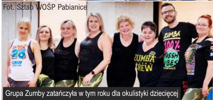
Grupa Zumby zatańczyła w tym roku dla okulistyki dziecięcej