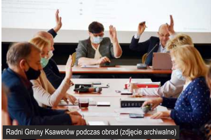
Radni Gminy Ksawerów podczas obrad (zdjęcie archiwalne)

W środę 23 lutego br. w Gminnym Domu Kultury z Biblioteką w Ksawerowie odbyła się XLVIII Sesja Rady Gminy Ksawerów poprzedzona wspólnym posiedzeniem Komisji Budżetu, Gospodarki, Rolnictwa i Ochrony Środowiska oraz Komisji Samorządowo-Społecznej.