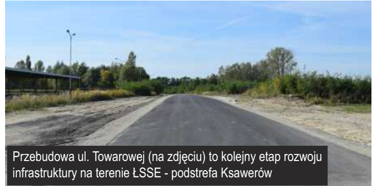
Przebudowa ul. Towarowej (na zdjęciu) to kolejny etap rozwoju infrastruktury na terenie ŁSSE - podstrefa Ksawerów

24 lutego br. podpisana została umowa z Wykonawcą na przebudowę drogi - ul. Towarowej w Ksawerowie. W ramach tego zadania zostanie również wybudowany chodnik, sieć oświetlenia ulicznego oraz sieci wod-kan. To kolejny etap inwestycji na terenie Łódzkiej Specjalnej Strefy Ekonomicznej - podstrefa Ksawerów. Wykonawca na zrealizowanie zadania będzie miał 6 miesięcy od dnia podpisania umowy. Referat Zamówień Publicznych i Środków Zewnętrznych