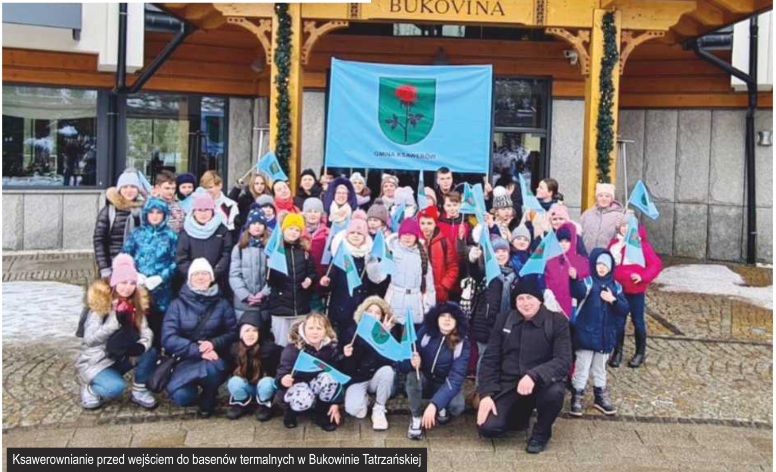
Ksawerownianie przed wejściem do basenów termalnych w Bukowinie Tatrzańskiej

21 lutego w poniedziałek blisko 60 dzieci i młodzieży wraz z opiekunami wyruszyło w zimową podróż w Pieniny. Częstochowa, Szczawnica, Bukovina Tatrzańska, zamek w Czorsztynie – to główne atrakcje tygodniowego pobytu w górach.