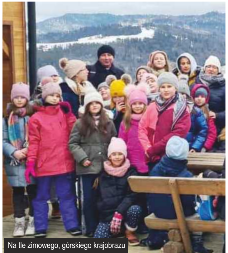
Na tle zimowego, górskiego krajobrazu