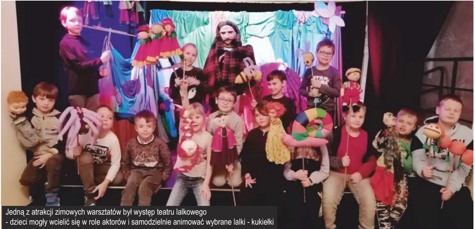
Jedną z atrakcji zimowych warsztatów był występ teatru lalkowego - dzieci mogły wcielić się w role aktorów i samodzielnie animować wybrane lalki - kukielki

W trakcie tegorocznego zimowego wypoczynku GDKzB zaproponował dla grupy dzieci i młodzieży udział w warsztatach artystycznych. Każdego dnia odbywały się warsztaty plastyczne, muzyczno-ruchowe, teatralne, były też gry i zabawy dydaktyczne. Przez pięć kolejnych dni (od 14 do 18 lutego) wszyscy fantastycznie się bawili i na nudę nikt nie narzekał.