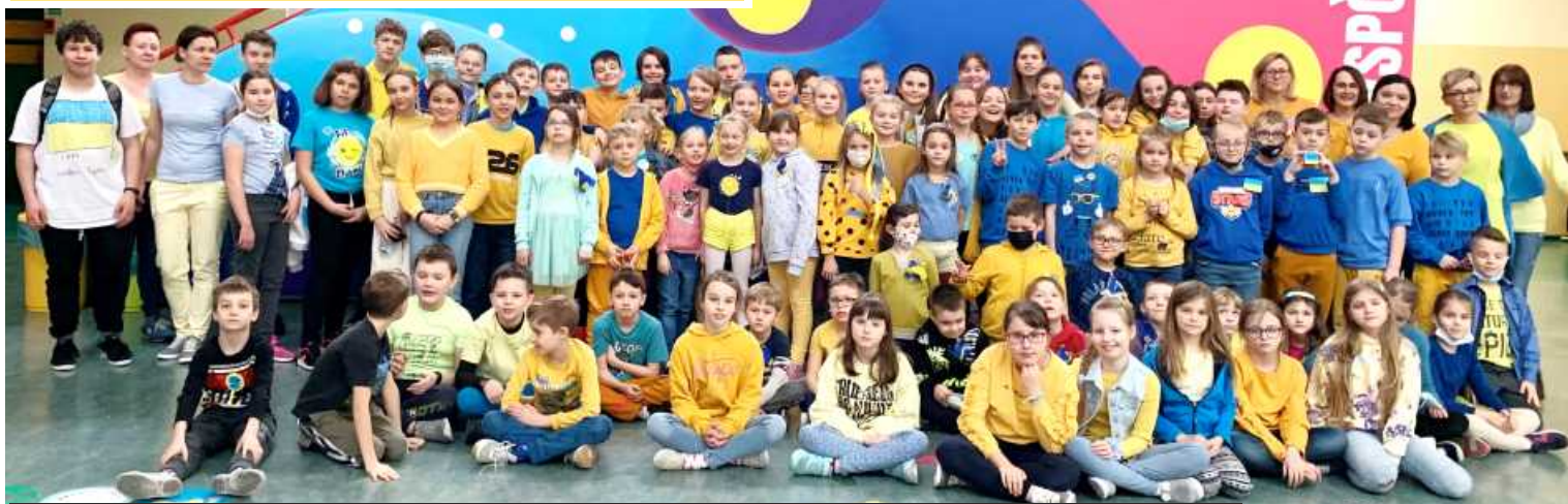
Pedagodzy i uczniowie Szkoły Podstawowej w Ksawerowie zaangażowani w pomoc dla sąsiadów zza wschodniej granicy

W związku z wybuchem wojny na Ukrainie społeczność Szkoły Podstawowej im. dr. Henryka Jordana w Ksawerowie zaangażowała się w akcję niesienia pomocy mieszkańcom tego kraju.