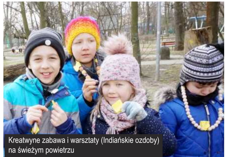
Kreatywne zabawa i warsztaty (Indiańskie ozdoby) na świeżym powietrzu

Dowiedz się więcej na... www.kultura-ksawerow.pl