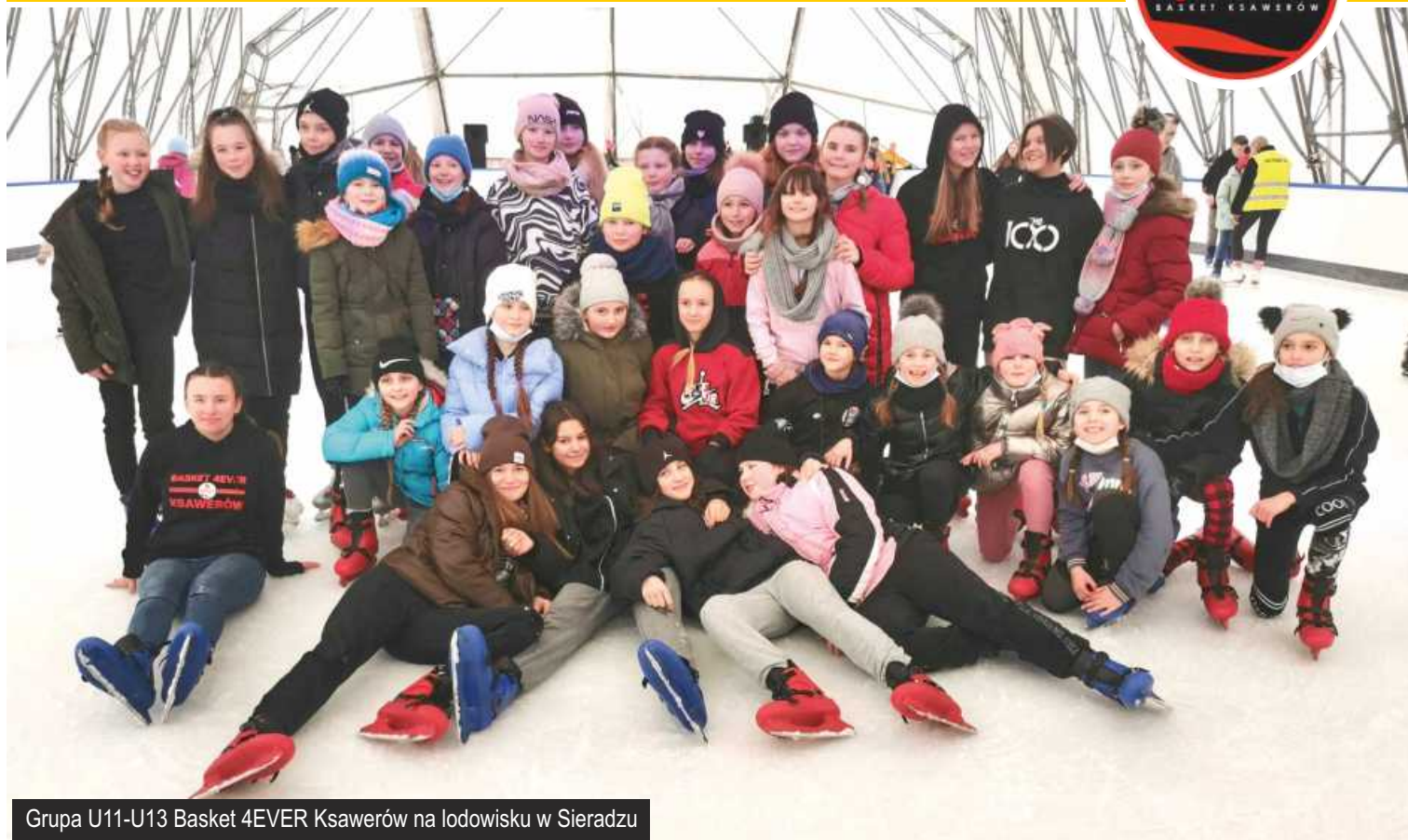
Grupa U11-U13 Basket 4EVER Ksawerów na lodowisku w Sieradzu

Tradycyjnie już, jak co roku, klub Basket 4EVER Ksawerów zorganizował dla swoich koszykarek w drugim tygodniu zimowych ferii treningi przygotowawcze do kolejnej, drugiej części sezonu.