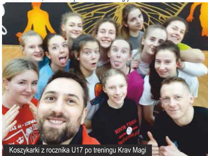
Koszykarki z rocznika U17 po treningu Krav Magi wspólnie z klubem United Krav Maga Tuszyn

Mowa tutaj o drużynach z rocznika U13, U15 i U17, dla których był to okres wzmożonej pracy i przygotowań do nadchodzących Mistrzostw Polski. W tym roku zespoły rozjechały się po całym województwie łódzkim trenując m.in. w Sieradzu i w Belchatowie. Najmłodsze "Koszyczki" zostały w Ksawerowie, ale na nudę narzekać nie mogły.