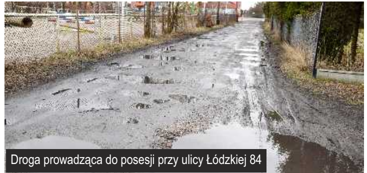
Droga prowadząca do posesji przy ulicy Łódzkiej 84

Mieszkańcy posesji położonych przy ul. Łódzkiej 84 w Ksawerowie narzekają na fatalny stan drogi dojazdowej do ich domów. Wszystkiemu winna nawierzchnia, która została "odtworzona" po ubiegłorocznym położeniu kanalizacji sanitarnej.