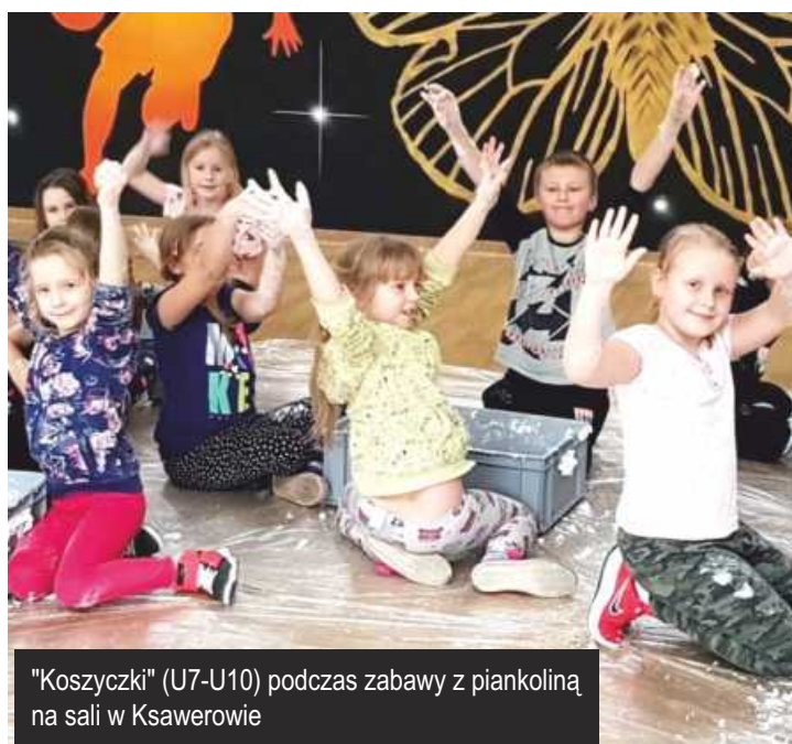
"Koszyczki" (U7-U10) podczas zabawy z piankolina na sali w Ksawerowie