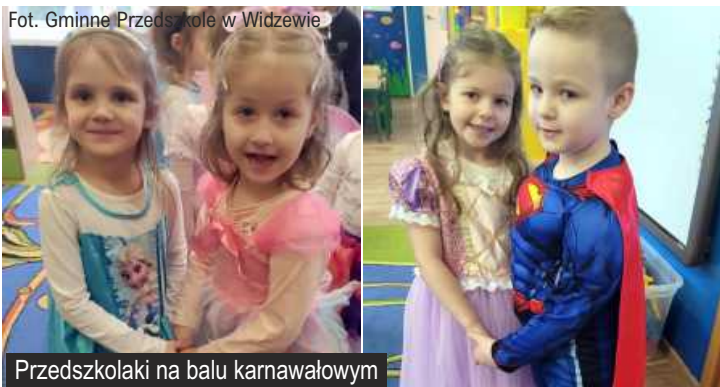
Przedszkolaki na balu karnawałowym