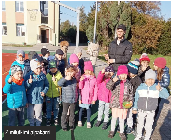
Z miłutkimi alpakami...