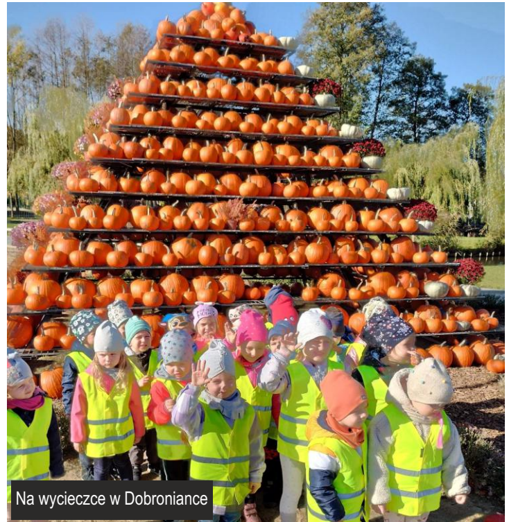
Na wycieczce w Dobroniance