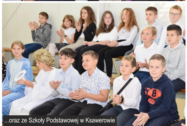
...oraz ze Szkoły Podstawowej w Ksawerowie