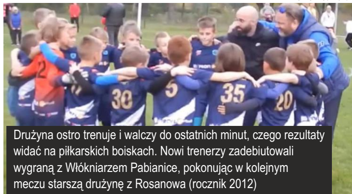
Drużyna ostro trenuje i walczy do ostatnich minut, czego rezultaty widać na piłkarskich boiskach. Nowi trenerzy zadebiutowali wygraną z Włóknierzem Pabianice, pokonując w kolejnym meczu starszą drużynę z Rosanowa (rocznik 2012)