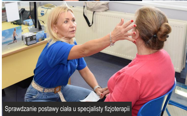
Sprawdzanie postawy ciała u specjalisty fizjoterapii