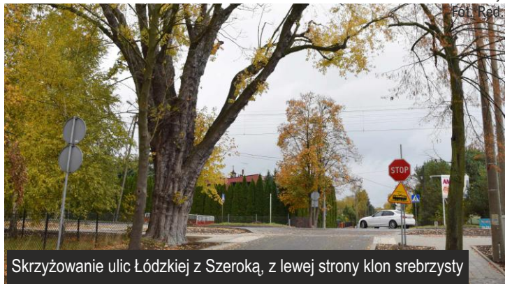
Skrzyżowanie ulic Łódzkiej z Szeroką, z lewej strony klon srebrzysty