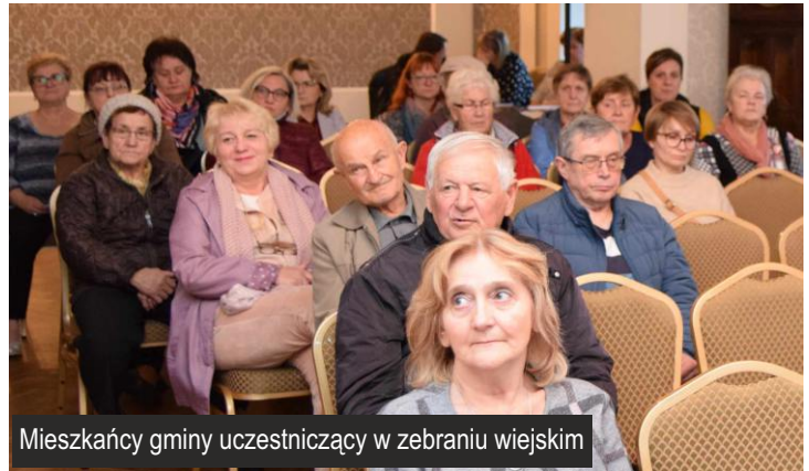
Mieszkańcy gminy uczestniczący w zebraniu wiejskim