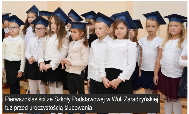
Pierwszoklasiści ze Szkoły Podstawowej w Woli Zaradzyńskiej tuż przed uroczystością ślubowania