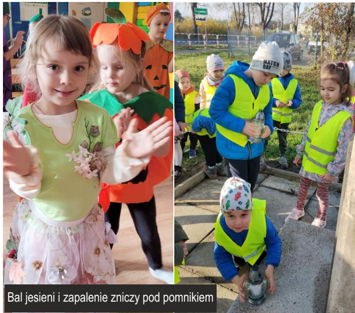
Bal jesieni i zapalenie zniczy pod pomnikiem

Zespół Szkolno-Przedszkolny w Ksawerowie