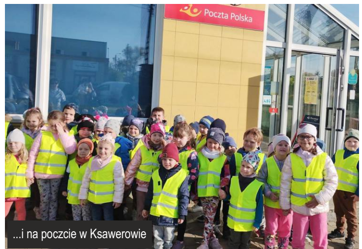
...i na poczcie w Ksawerowie