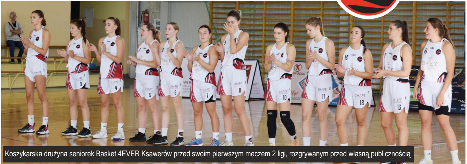
Koszykarska drużyna seniorek Basket 4EVER Ksawerów przed swoim pierwszym meczem 2 ligi, rozgrywanym przed własną publicznością

15 października nasze koszykarki zagrały swój pierwszy, historyczny mecz w II lidze kobiet. Nie zabrakło w nim sportowej rywalizacji na najwyższym poziomie, licznego wsparcia i głośnego dopingu ksawerowskiej publiczności.