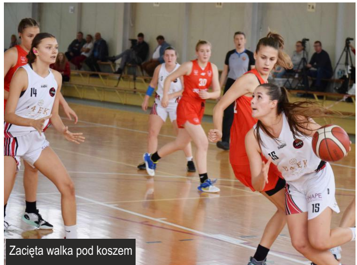
Zacięta walka pod koszem