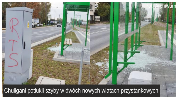
Chuligani potłukli szyby w dwóch nowych wiatach przystankowych