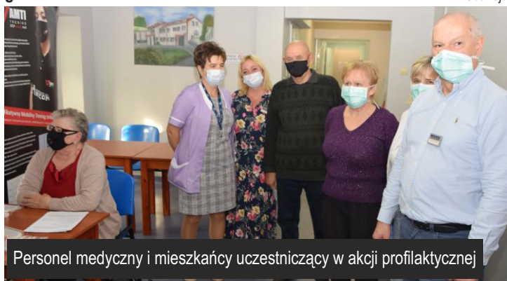
Personel medyczny i mieszkańcy uczestniczący w akcji profilaktycznej