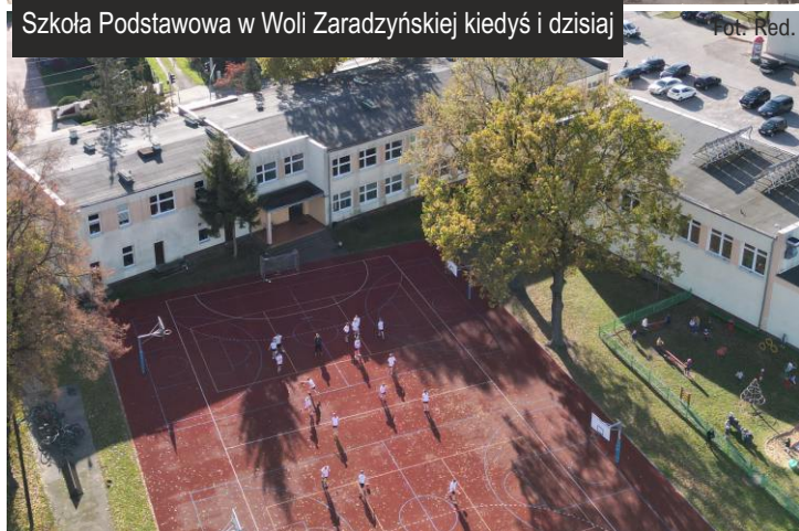
Szkoła Podstawowa w Woli Zaradzyńskiej kiedyś i dzisiaj