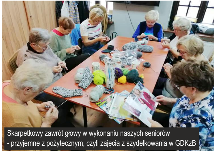
Skarpetkowy zawrót głowy w wykonaniu naszych seniorów - przyjemne z pożytecznym, czyli zajęcia z szydełkowania w GDKzB