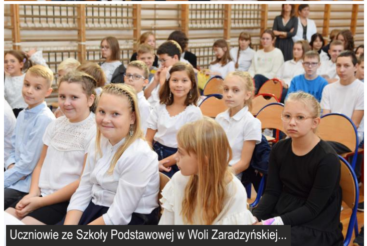
Uczniowie ze Szkoły Podstawowej w Woli Zaradzyńskiej...