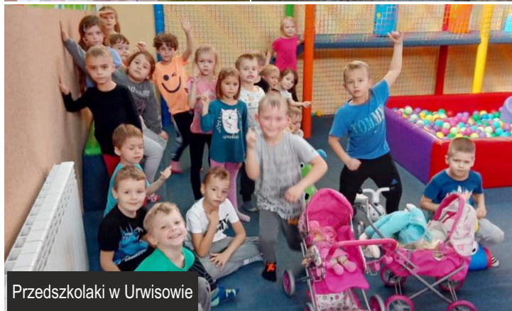
Przedшкоlaki w Urwisowie