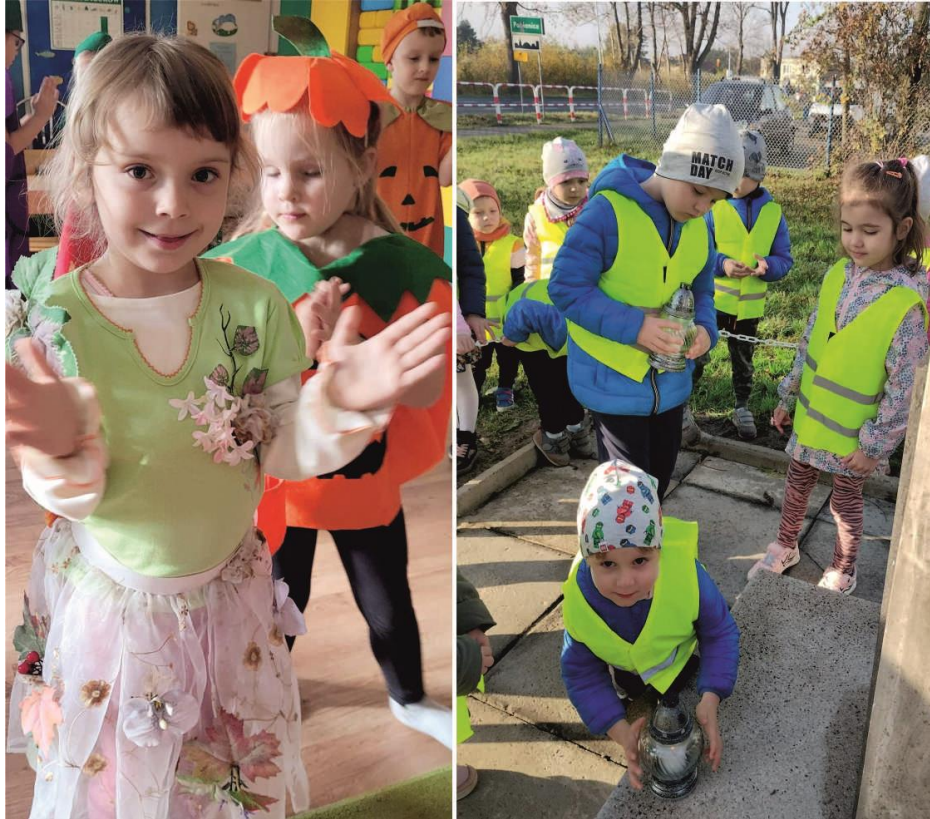
Zdjęcie przedstawia przedszkolaki podczas balu i przed pomnikiem. Fotografia jest archiwalna.