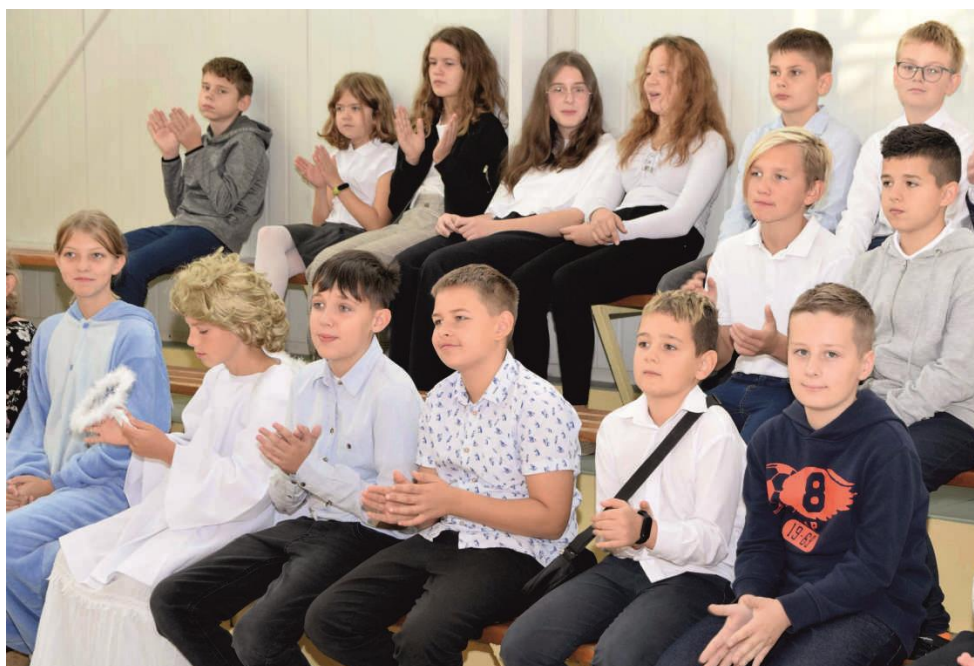
Zdjęcie przedstawia uczniów Szkoły Podstawowej w Ksawerowie.