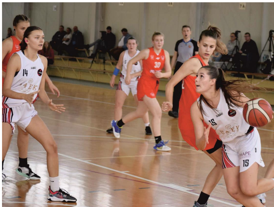
Zdjęcie przedstawia koszykarki podczas pierwszego meczu drugiej ligi w Ksawerowie.