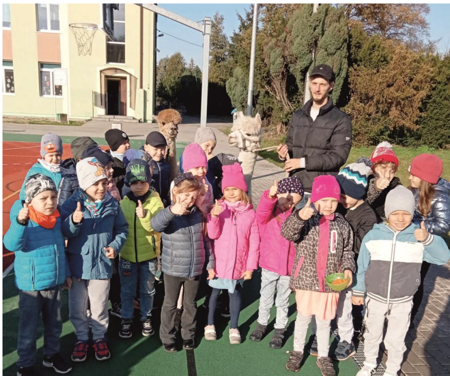
Zdjęcie przedstawia przedszkolaki w towarzystwie alpaka. Fotografia jest archiwalna.