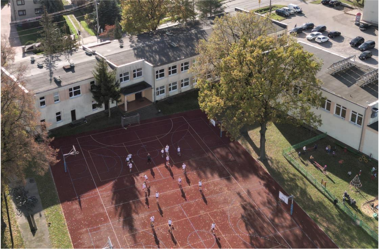
Zdjęcie przedstawia dzisiejszy budynek i teren Szkoły Podstawowej w Woli Zaradzyńskiej.