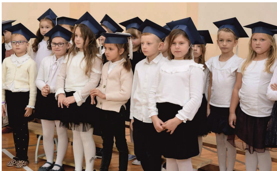
Zdjęcie przedstawia uczniów – pierwszoklasistów Szkoły Podstawowej w Woli Zaradzyńskiej.