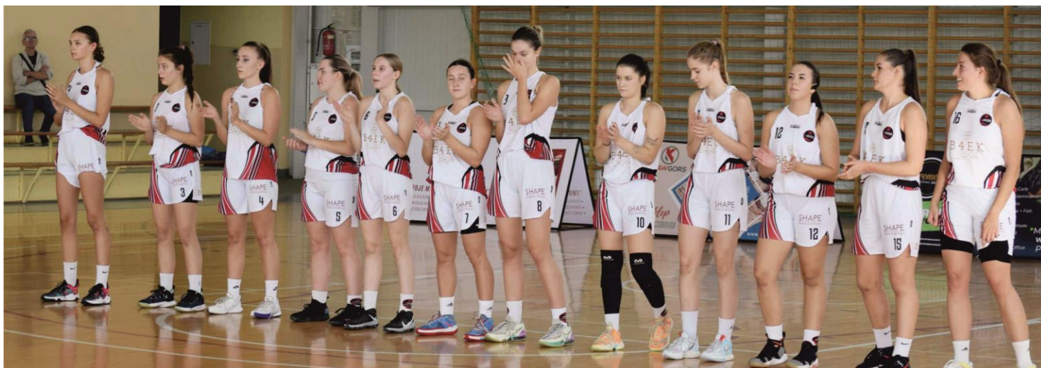
Zdjęcie przedstawia koszykarki, drużynę Basket 4EVER Ksawerów.