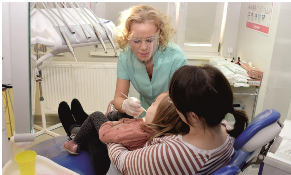
Zdjęcie przedstawia badanie stomatologiczne.