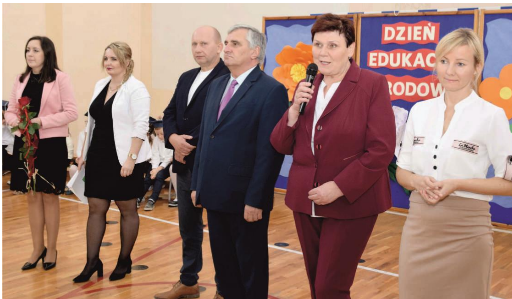
Zdjęcie przedstawia delegację samorządu gminy Ksawerów i pracowników Urzędu Gminy Ksawerów uczestniczących w uroczystości.