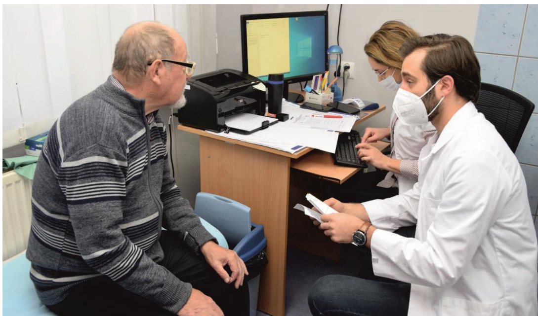
Zdjęcie przedstawia konsultację lekarską.