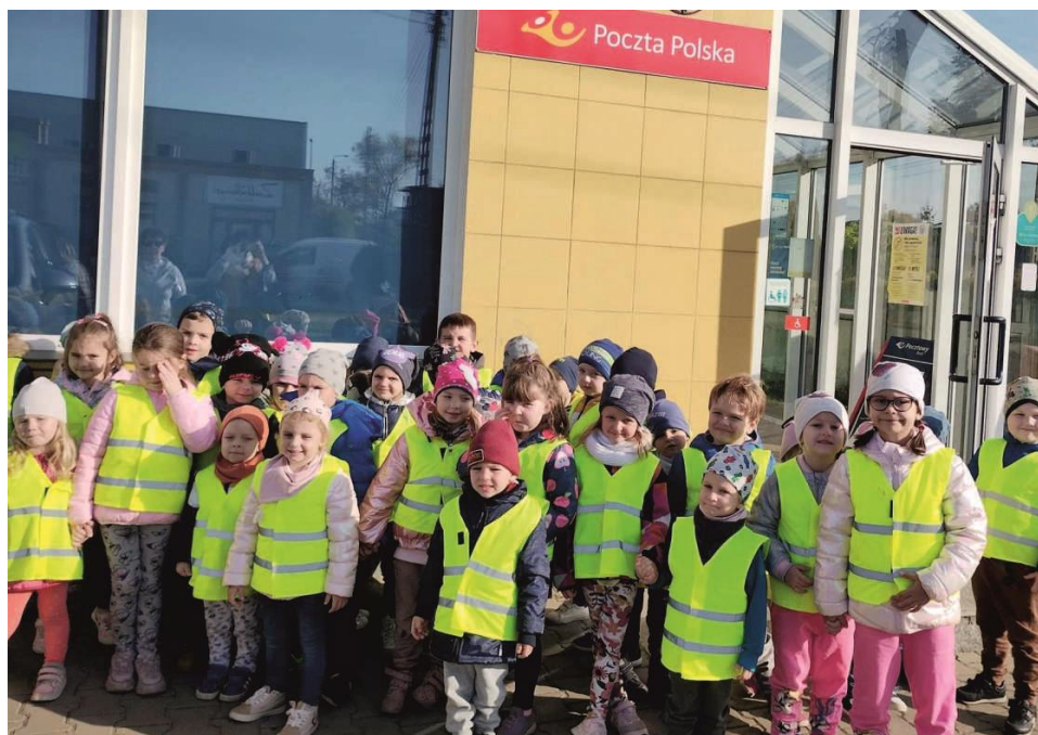
Zdjęcie przedstawia przedszkolaki w przed budynkiem poczty. Fotografia jest archiwalna. Informację przygotował Zespół Szkolno-Przedszkolny w Ksawerowie.