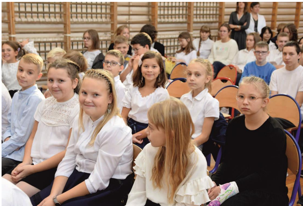
Zdjęcie przedstawia uczniów Szkoły Podstawowej w Woli Zaradzyńskiej.