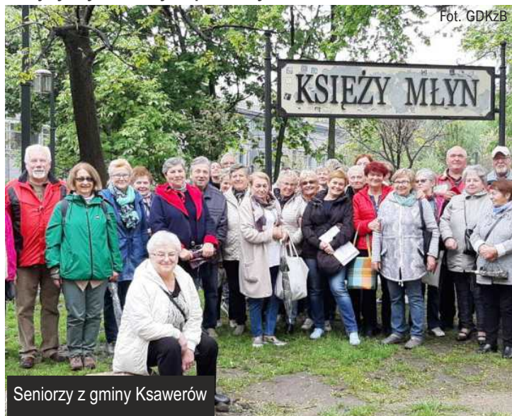
Seniorzy z gminy Ksawerów

Zachęcamy mieszkańców naszej gminy w wieku 60+ do zgłaszania swoich kandydatur do gminnej rady seniorów. Chcesz aktywnie uczestniczyć w życiu gminy? Podobnie jak w przypadku młodzieży, gminna rada seniorów ma charakter konsultacyjny, doradczy i inicjatywny. Czekamy i zapraszamy!