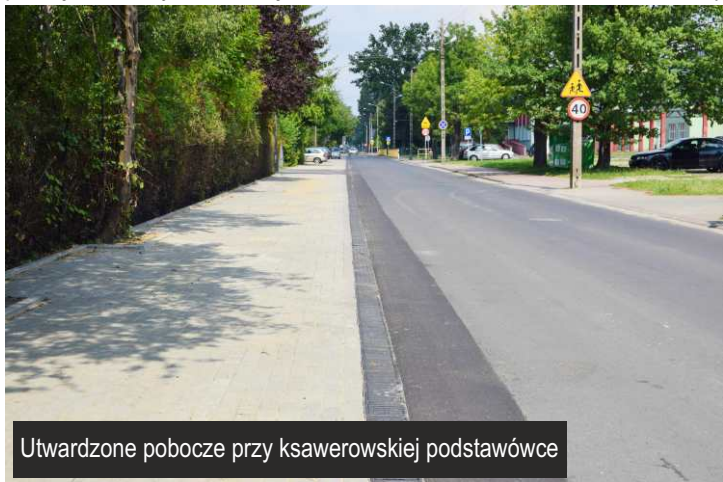
Utwardzone pobocze przy ksawerowskiej podstawówce