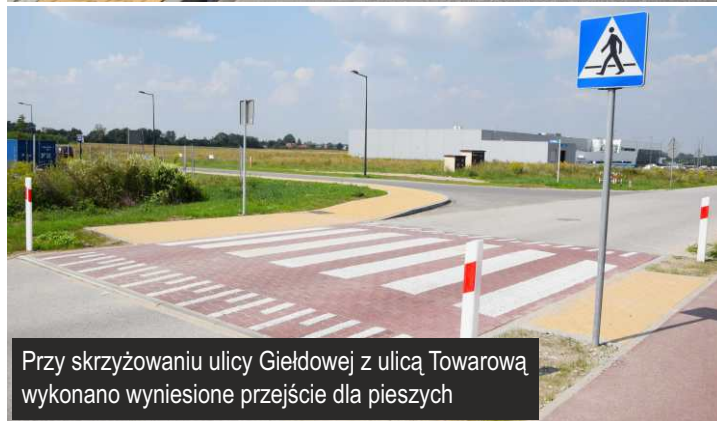
Przy skrzyżowaniu ulicy Giełdowej z ulicą Towarową wykonano wyniesione przejście dla pieszych