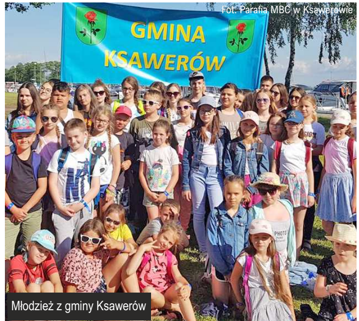
Młodzież z gminy Ksawerów