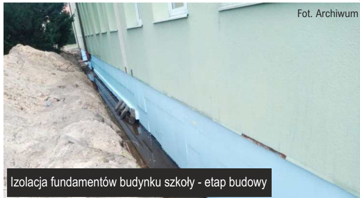
Izolacja fundamentów budynku szkoły - etap budowy