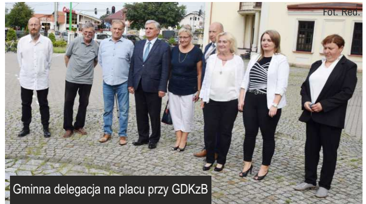
Gminna delegacja na placu przy GDKzB

Referat Oświaty, Spraw Społecznych i Promocji