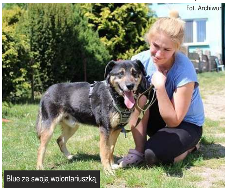
Blue ze swoją wolontariuszką