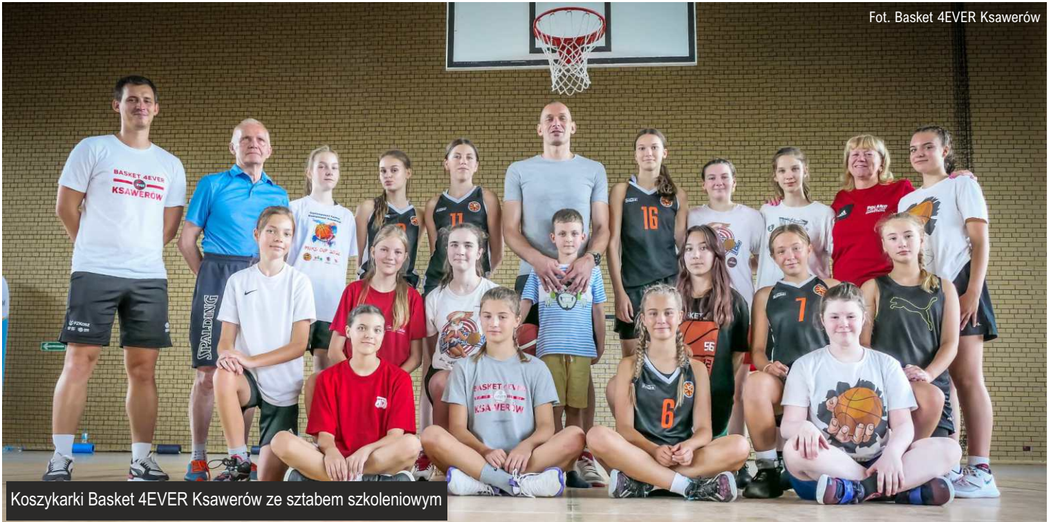
Koszykarki Basket 4EVER Ksawerów ze sztabem szkoleniowym

Minęło zaledwie cztery lata jak koszykarki z Ksawerowa wystąpiły pierwszy raz pod szyldem BASKET 4EVER KSAWERÓW. Teraz klub ma przyjemność ogłosić, że od nowego sezonu 2022/2023 będzie występował w II lidze seniorskiej. Pierwsze mecze odbędą się już na początku października.