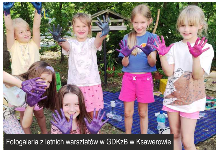
Fotogaleria z letnich warsztatów w GDKzB w Ksawerowie