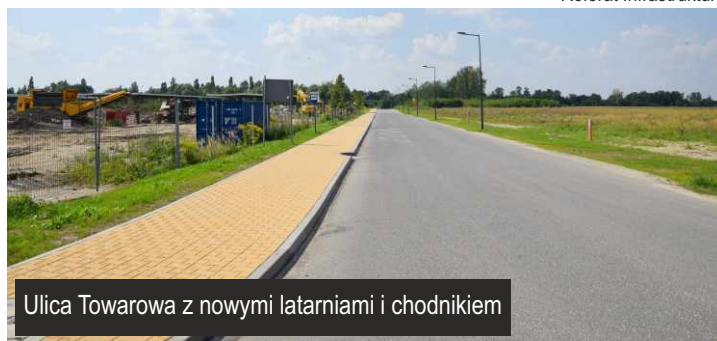
Ulica Towarowa z nowymi latarniami i chodnikiem