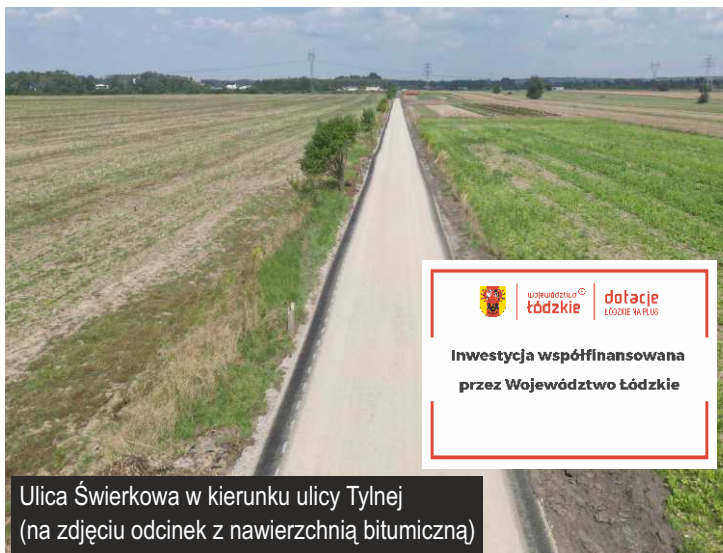
Ulica Świerkowa w kierunku ulicy Tylnej (na zdjęciu odcinek z nawierzchnią bitumiczną)