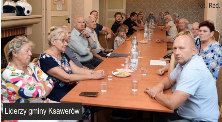
Liderzy gminy Ksawerów

4 lipca w GDKzB w Ksawerowie spotkali się władarze naszej gminy, pracownicy urzędu oraz lokalni Liderzy - m.in. radni gminy, sołtysi i członkowie rad sołeckich. Dyskutowano przede wszystkim o sprawach bieżących związanych z gminą, inwestycjach oraz oświacie.