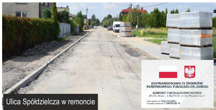
Ulica Spółdzielcza w remoncie