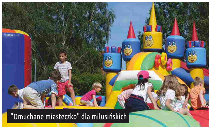
"Dmucane miasteczko" dla milusińskich