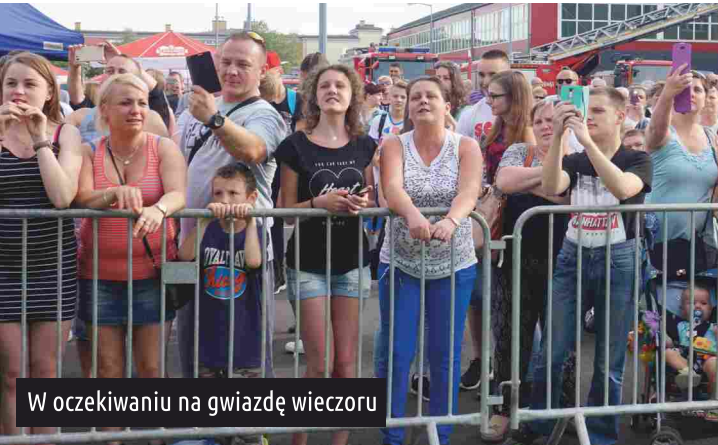
W oczekiwaniu na gwiazdę wieczoru