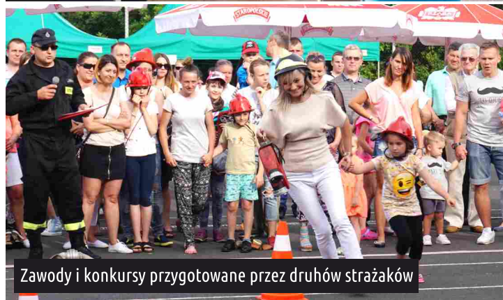
Zawody i konkursy przygotowane przez druhow strażaków