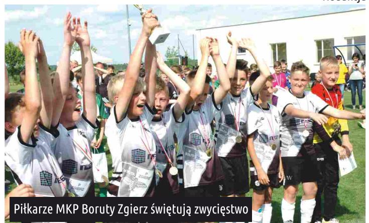
Piłkarze MKP Boruty Zgierz świętują zwycięstwo