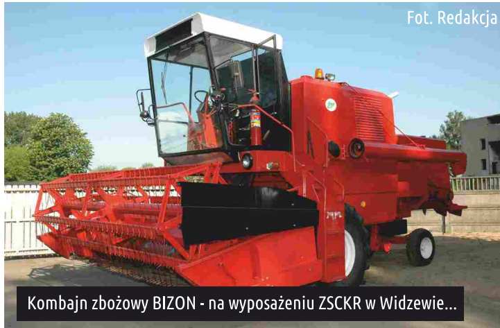
Kombajn zbożowy BIZON - na wyposażeniu ZSKCR w Widzewie...