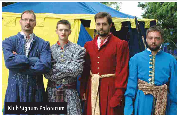
Klub Signum Polonicum