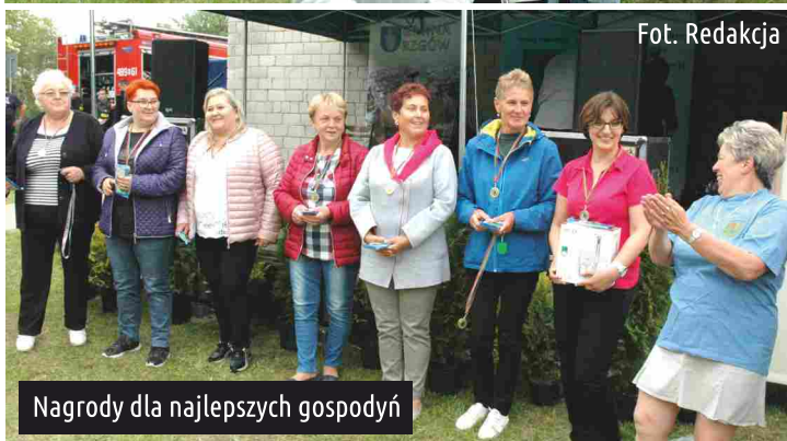
Nagrody dla najlepszych gospodyń