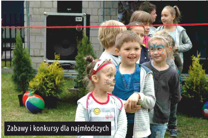
Zabawy i konkursy dla najmłodszych

Referat Oświaty, Spraw Społecznych i Promocji