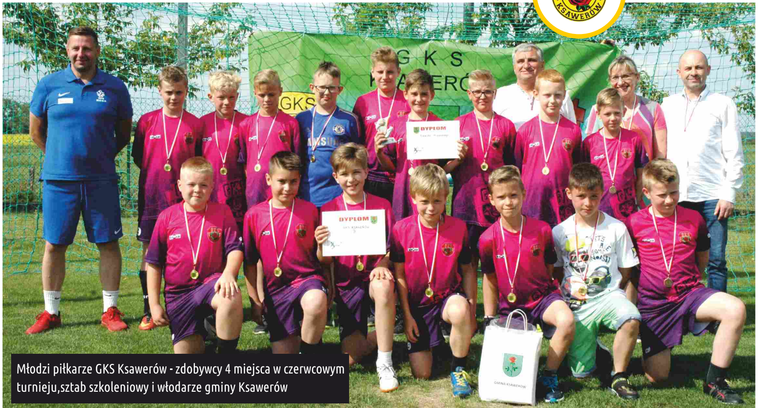
Młodzi piłkarze GKS Ksawerów - zdobywcy 4 miejsca w czerwcowym turnieju, sztab szkoleniowy i władze gminy Ksawerów

11 czerwca w słoneczną niedzielę, młodzi adepci piłki nożnej rozegrali "Letni Turniej o Puchar wójta gminy Ksawerów z okazji 20 rocznicy powstania gminy Ksawerów". Zawody, w których udział wzięło 10 drużyn: GKS Ksawerów, MUKS Włóknierz Pabianice, MUKS Włóknierz Pabianice II, AC Milan Łódź, GLKS Dłutów, Orzeł Piątkowisko, BKS Start Brzeziny, MKS Tuszyń, MKP Boruta Zgierz, RTS Widzew Łódź, odbyły się na boiskach Gminnego Klubu Sportowego GKS Ksawerów, przy ul. Hubala 55 w Woli Zaradzyńskiej.