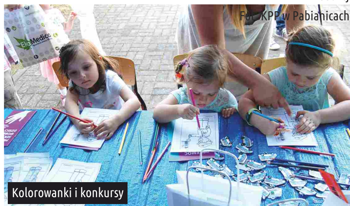
Kolorowanki i konkursy