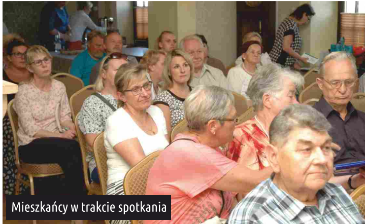
Mieszkańcy w trakcie spotkania

19 czerwca w GDKzB odbyło się kolejne spotkanie z Sottysami, Radami Sołectkimi oraz mieszkańcami naszej gminy. Podczas spotkania pracownicy Urzędu Gminy Ksawerów przedstawili zagadnienia dotyczące istotnych sfer działalności na rzecz poprawy jakości życia mieszkańców, oraz warunków sprzyjających rozwojowi przedsiębiorczości na terenie Gminy Ksawerów.