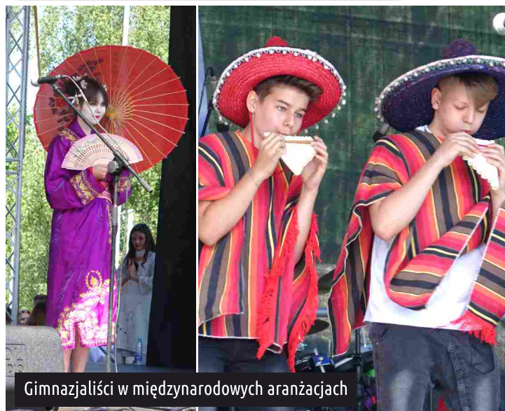
Gimnazjaliści w międzynarodowych aranżacjach

Referat Oświaty, Spraw Społecznych i Promocji