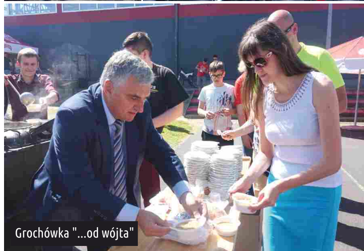
Grochówka "...od wójta"