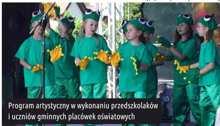
Program artystyczny w wykonaniu przedszkolaków i uczniów gminnych placówek oświatowych