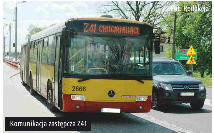
Komunikacja zastępcza Z41

Trasa: CHOCIANOWICE IKEA – Pabianicka, Łódzka, Warszawska, Zamkowa, Łaska – DWORZEC PKP PABIANICE PRZYSTANEK: CHOCIANOWICE IKEA (2015)