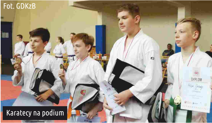
Karatecy na podium