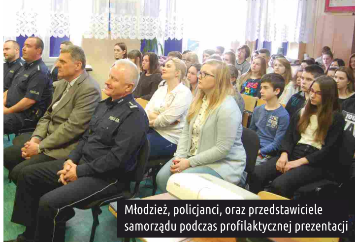
Młodzież, policjanci, oraz przedstawiciele samorządu podczas profilaktycznej prezentacji