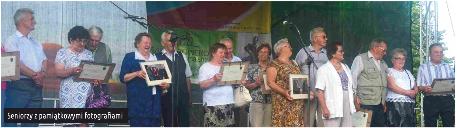
Seniorzy z pamiątkowymi fotografiami