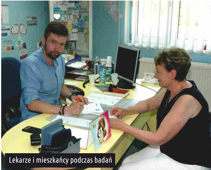
Lekarze i mieszkańcy podczas badań

Wszystkie wykonane w tym dniu badania sfinansowane zostały przez gminę Ksawerów, SP ZOZ MEDiKSA oraz przez Narodowy Fundusz Zdrowia. Ogółem wykonano 232 badań profilaktycznych i przebadano 88 osób. Wyniki konsultacji lekarzy specjalistów: chirurga onkologa, pulmonologa jak również badania USG - umieszczone zostały w dokumentacji medycznej każdego przebadanego w tym zakresie pacjenta. Osoby, u których wykryto nieprawidłowości, zostaną skierowane do poradni specjalistycznych celem dalszej diagnostyki.