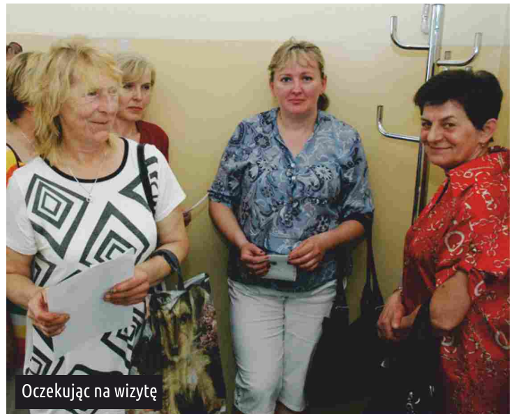
Oczekując na wizytę