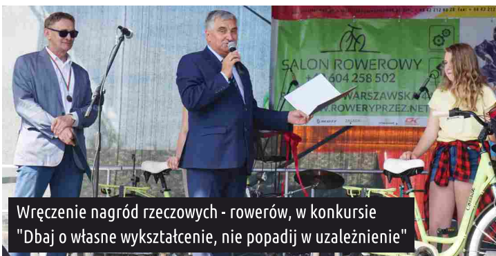
Wręczenie nagród rzeczowych - rowerów, w konkursie "Dbaj o własne wykształcenie, nie popadaj w uzależnienie"