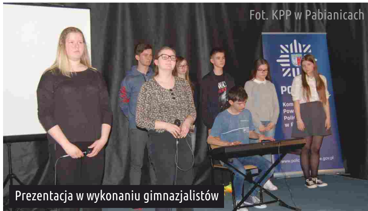
Prezentacja w wykonaniu gimnazjalistów