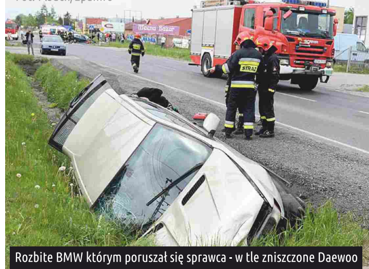
Rozbite BMW którym poruszał się sprawca - w tle zniszczone Daewoo