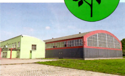
■ Hala sportowa przy szkole podstawowej