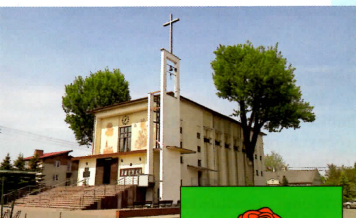
■ Kościół parafialny w Ksawerowie