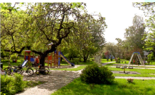
■ Park gminny