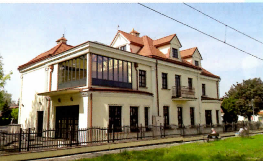
■ Gminny Dom Kultury w Ksawerowie

Ksawerów jest gminą wiejską, położoną w centrum województwa łódzkiego. Jej atutem jest bliskość stolicy województwa, ale także tendencja społeczeństwa do osiedlania się poza dużymi miastami. Dzięki temu w Ksawerowie systematycznie rośnie liczba mieszkańców.